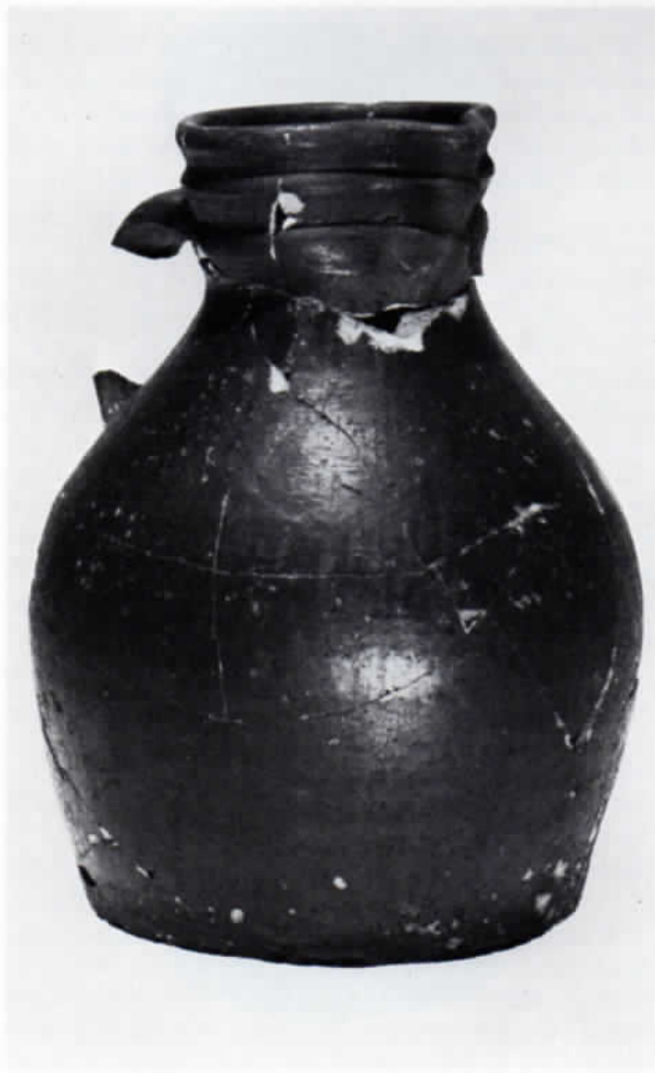
Abb. 6: Bauchige Kanne, reduzierend gebrannt. Höhe 22,5 cm.

Oxidierend gebrannte Ware spielt im Fundort von Moosburg nur eine geringe Rolle. Die vorherrschende Glasurfarbe ist grün in allen Spielarten. Gelbe und bräunliche Farbtöne gehören (noch) zu den Seltenheiten. Von wenigen Ausnahmen abgesehen ist nur die Innenseite der Gefäße glasiert.