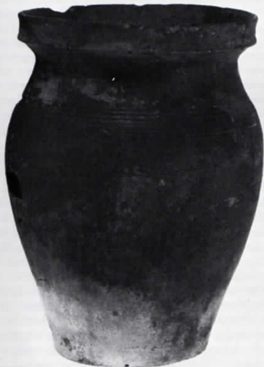
Abb. 1: Henkelloser Topf, reduzierend gebrannt. Höhe 19,5 cm.

Keramik wurde an zwei Stellen der Baugrube gefunden, die miteinander nicht in Verbindung standen. Der größte Teil des Fundguts stammt aus einem Profil im südwestlichen Teil der Baustelle, das auf eine Länge von 7,5 m aufgeschlossen war. Auf einer Unterlage aus Feinkies breitete sich eine 20 bis 40 cm mächtige dunkle Schicht aus, die neben keramischem Material vor allem Bachgerölle, Ziegelbrocken, Schlacken sowie Knochen und Zähne von Haustieren enthielt. Darüber folgten 40 bis 60 cm mächtige gelbgraue bis braune feinsandige Tone, die von einer 30 bis 40 cm dicken humösen Schicht mit Wurzelresten überlagert wurden. Um die scherbenführende