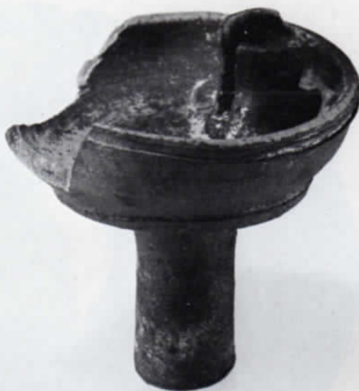
Abb. 7: Oberer Teil eines Schaftleuchters, reduzierend gebrannt. Höhe des Fragments 8 cm.

Geschirrkemik – Der Formenschatz reicht von Henkel-töpfen (Abb. 8) über Dreibeintöpfe zu Krügen (Höhe bis zu 36,5 cm), Kannen, Schüsseln, Schalen und Tellern. Besonders hervorzuheben sind sogenannte Oakasmodeln, in denen eine österliche Speise aus Milch, Eiern und Rosinen zubereitet wurde. 12 Diese Hohlformen tragen auf der Unterseite kleine Stummelfüßchen. Sie sind außerdem mit Durchbohrungen für das Abfließen der Molke versehen. Das abgebildete Stück (Abb. 9) zeigt das Osterlamm mit Kreuz und Fahne. Ein weiterer Model lässt über dem Kopf des Tieres das Emblem für Glaube, Hoffnung und Liebe erkennen. Ferner wurden ein Fragment einer Krebsmodel sowie zahlreiche weitere Bruchstücke mit verschiedenen Dekoren gefunden. 13