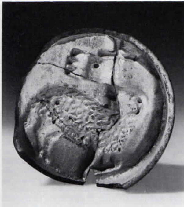
Abb. 9: Oakasmodel mit Osterlamm, innen grün glasiert. Durchmesser 16 cm.

Bruchstücke von durchbrochenen Kacheln, die als Ofenaufsatz dienten, lassen einen Engelkopf, den lorbeerbekränzten Kopf eines Poeta laureatus sowie eine Volute mit Rosette erkennen.