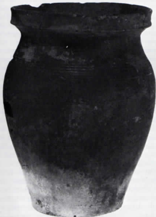
Abb. 1: Henkelloser Topf, reduzierend gebrannt. Höhe 19,5 cm.

Keramik wurde an zwei Stellen der Baugrube gefunden, die miteinander nicht in Verbindung standen. Der größte Teil des Fundguts stammt aus einem Profil im südwestlichen Teil der Baustelle, das auf eine Länge von 7,5 m aufgeschlossen war. Auf einer Unterlage aus Feinkies breitete sich eine 20 bis 40 cm mächtige dunkle Schicht aus, die neben keramischem Material vor allem Bachgerölle, Ziegelbrocken, Schlacken sowie Knochen und Zähne von Haustieren enthielt. Darüber folgten 40 bis 60 cm mächtige gelbgraue bis braune feinsandige Tone, die von einer 30 bis 40 cm dicken humösen Schicht mit Wurzelresten überlagert wurden. Um die scherbenführende