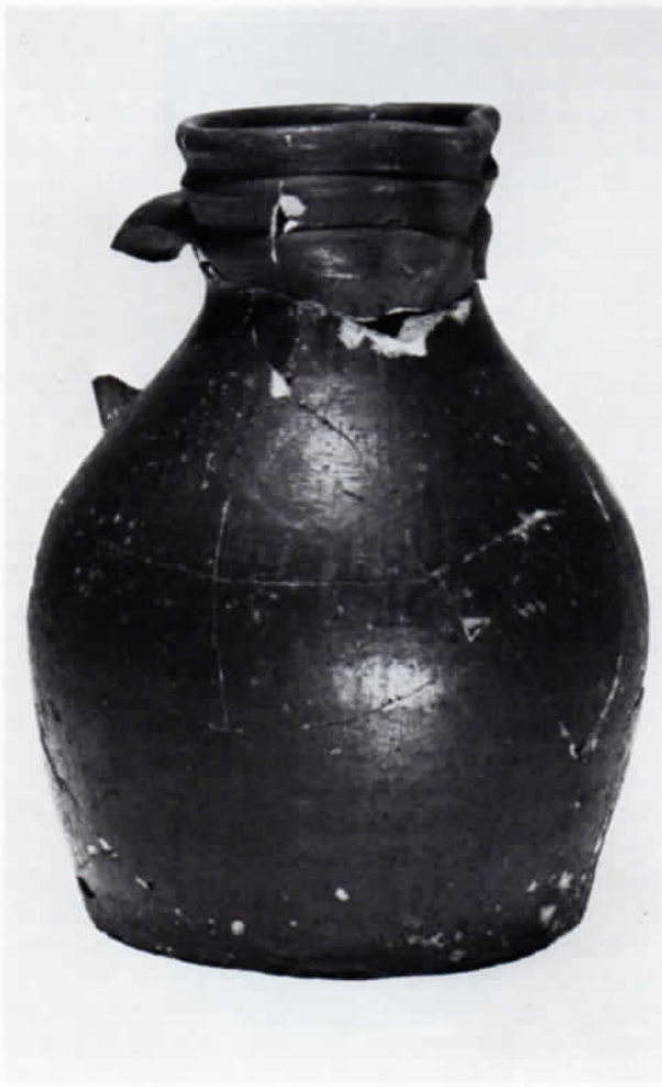
Abb. 6: Bauchige Kanne, reduzierend gebrannt. Höhe 22,5 cm.

Oxidierend gebrannte Ware spielt im Fundort von Moosburg nur eine geringe Rolle. Die vorherrschende Glasurfarbe ist grün in allen Spielarten. Gelbe und bräunliche Farbtöne gehören (noch) zu den Seltenheiten. Von wenigen Ausnahmen abgesehen ist nur die Innenseite der Gefäße glasiert.