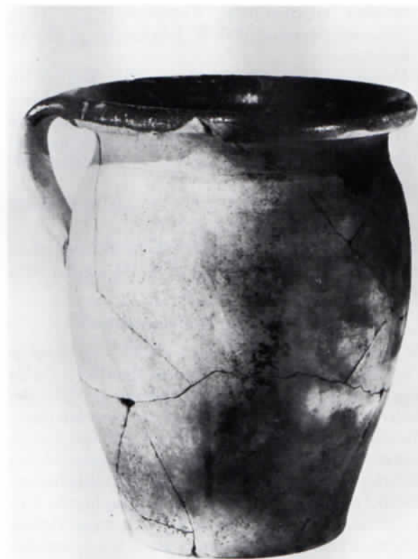
Abb. 8: Henkeltopf, oxidierend gebrannt, auf der Innenseite grün glasiert, mit deutlichen Gebrauchsspuren (Ruß). Höhe 20,7 cm.

Daneben wurden Reste von kleineren Fischen (Wirbel, Flossenstachel) entdeckt. Sie gehören zusammen mit Süßwasserschnecken (Radix, Planorbis) und Süßwassermuscheln (Pisidium) zu den ehemaligen Bewohnern eines träge fließenden Baches, in den auch Landschnecken von den Uferändern eingeschwemmt wurden.