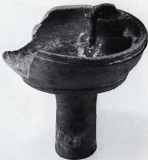
Abb. 7: Oberer Teil eines Schaftleuchters, reduzierend gebrannt. Höhe des Fragments 8 cm.

Geschirrkemik – Der Formenschatz reicht von Henkeltöpfen (Abb. 8) über Dreibeintöpfe zu Krügen (Höhe bis zu 36,5 cm), Kannen, Schüsseln, Schalen und Tellern. Besonders hervorzuheben sind sogenannte Oakasmodeln, in denen eine österliche Speise aus Milch, Eiern und Rosinen zubereitet wurde. 12 Diese Hohlformen tragen auf der Unterseite kleine Stummelfüßchen. Sie sind außerdem mit Durchbohrungen für das Abfließen der Molke versehen. Das abgebildete Stück (Abb. 9) zeigt das Osterlamm mit Kreuz und Fahne. Ein weiterer Model lässt über dem Kopf des Tieres das Emblem für Glaube, Hoffnung und Liebe erkennen. Ferner wurden ein Fragment einer Krebsmodel sowie zahlreiche weitere Bruchstücke mit verschiedenen Dekoren gefunden. 13