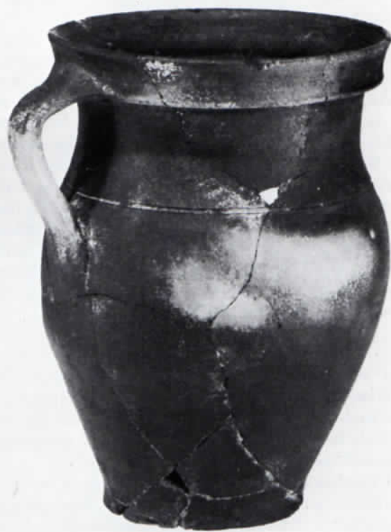
Abb. 2: Henkeltopf, reduzierend gebrannt. Höhe 18,3 cm.