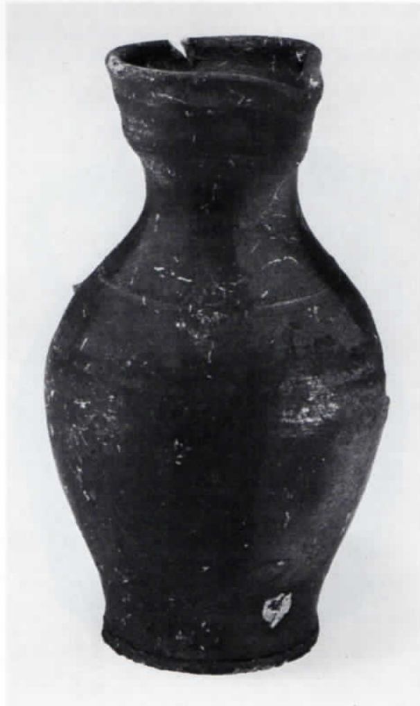
Abb. 5: Kleine Kanne, reduzierend gebrannt. Höhe 13,1 cm.

Schüsseln – Es herrscht der Typ der mittelgroßen, mitteltiefen bis tiefen Schüssel vor. Sie diente wohl der Milchwirtschaft. Eine Ähnlichkeit zum Material von Hundspoint 7 und Otlberg ist nicht zu übersehen. Ferner konnte ein größeres Fragment einer tiefen Schüssel mit Siebboden geborgen werden. Daneben wurde auch der Typ der weitmundigen, verhältnismäßig flachen Schale nachgewiesen, der in Niederbayern vom ausgehenden 15. Jahrhundert bis zu Beginn des 17. Jahrhunderts weit verbreitet ist. 8