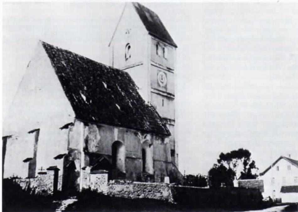
Das 1903 abgebrochene alte Olchinger Kirchlein mit dem Gottesacker, in dem die Cholenoten beendigt wurden. Der heutige Friedhof wurde erst 1875, das Leichenhaus 1900 errichtet.

»Im Markt Bruck hat sie zwei Opfer gefordert und besonders böse ist sie in dem benachbarten Dorf Emmering aufgetreten, wo sie durch Sommerfrischler