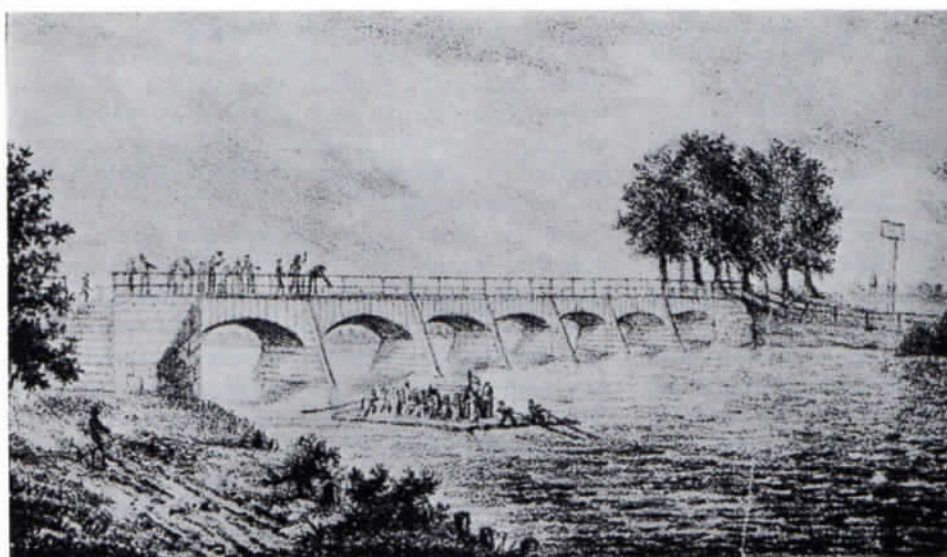
Die Freisinger Isarbrücke um 1867.