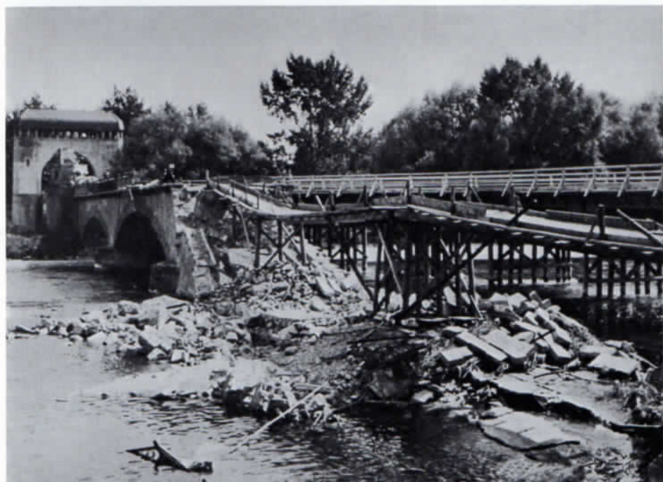
Die im Jahre 1945 zerstörte Freisinger Isarbrücke von 1894.