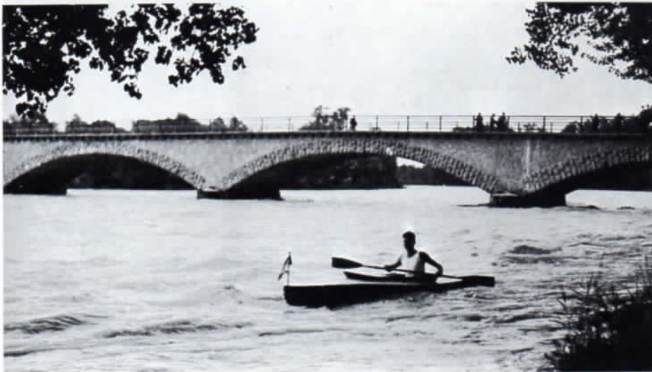
Die 1948 erbaute Freisinger Isarbrücke.