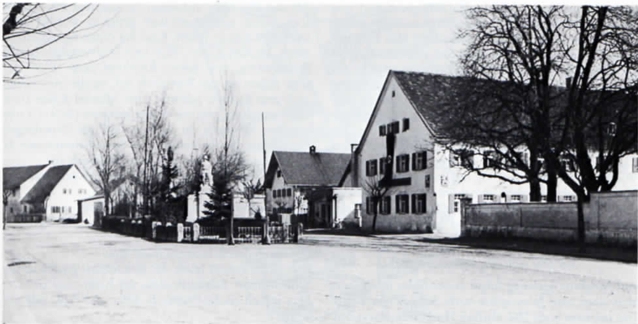
Der Feldmochinger »Marienplatz« mit dem 1923 errichteten Kriegerdenkmal und dahinter der Mariensäule von 1897, rechts die Gastwirtschaft Kaiser (1938).