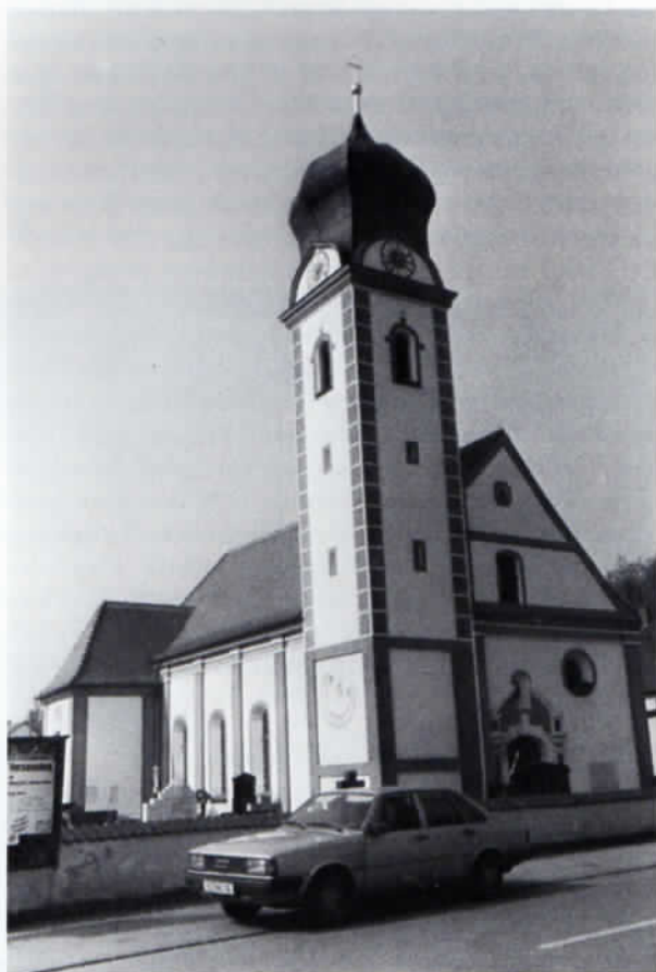
Die barocke Langenbacher Pfarrkirche wurde 1737 erbaut.