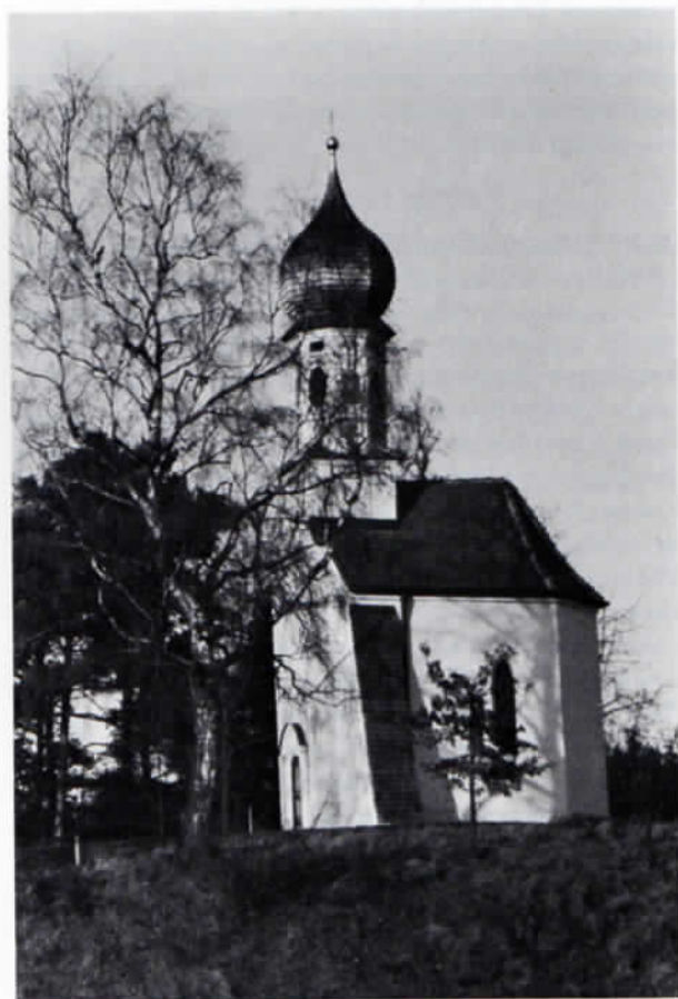
Das Georgskirchlein von Pelka bei Hohenkammer mit dem Zwiebel-dachreiter aus der Barockzeit.