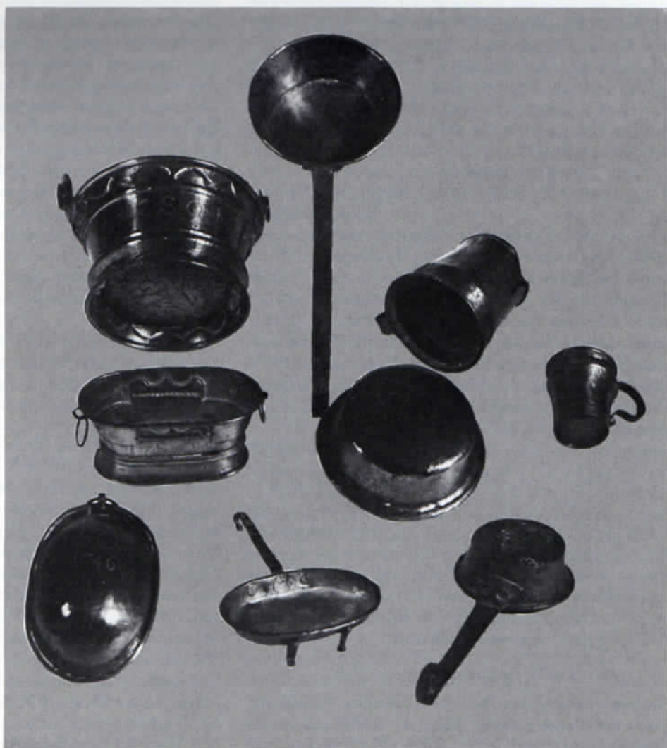
Spielzeuggeschirr aus Kupfer im Dachauer Bezirksmuseum.

Das Zinngeschirr umfaßt Spielzeugteller in fünf verschiedenen Größen, die jeweils am Tellerrand die Gravur »17 SÖ 48« und auf der Rückseite eine Zinnmarke aufweisen. Es handelt sich um 7 Teller mit 5,5 cm Durchmesser,