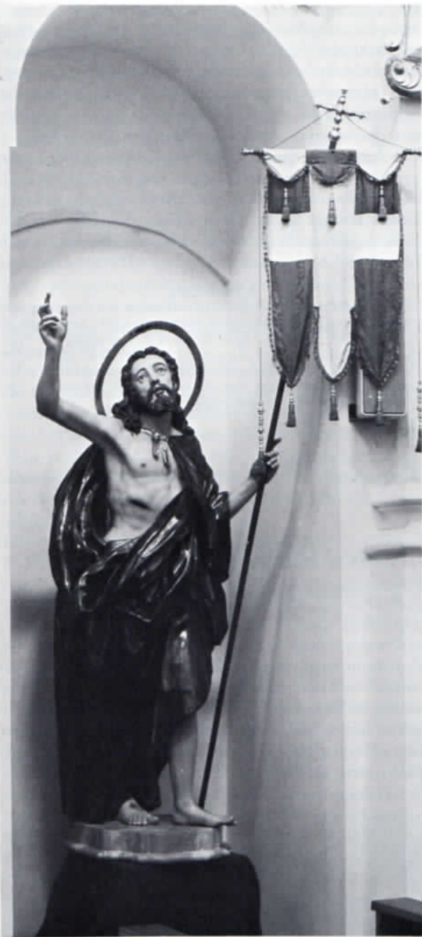
Pfarrkirche Kloster Indersdorf, der auferstandene Heiland.

Bischofsstab, wurden neu geschnitzt. Vorlage dafür war ein Dia, das um 1960 bei der letzten Instandsetzung erstellt worden war. Die Figur wurde dann in Leinöl-, Standöltechnik mehrmals eingelassen, gekittet, grundiert, gefaßt, Mantel und Stab mit Blattgold in Ölgoldtechnik vergoldet.