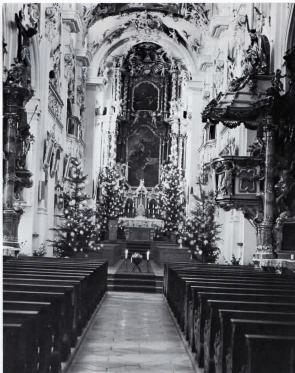
Pfarrkirche Kloster Indersdorf an Weihnachten 1986.

1976 wurden die Kosten auf DM 3,8 Mill., 1980 auf DM 5,75 Mill. und 1983 auf DM 8,12 Mill. geschätzt. Bis zum Jahresende 1986 wurden über DM 8 Mill. aufgewendet. Das Landbauamt München verwendete die Mittel für die