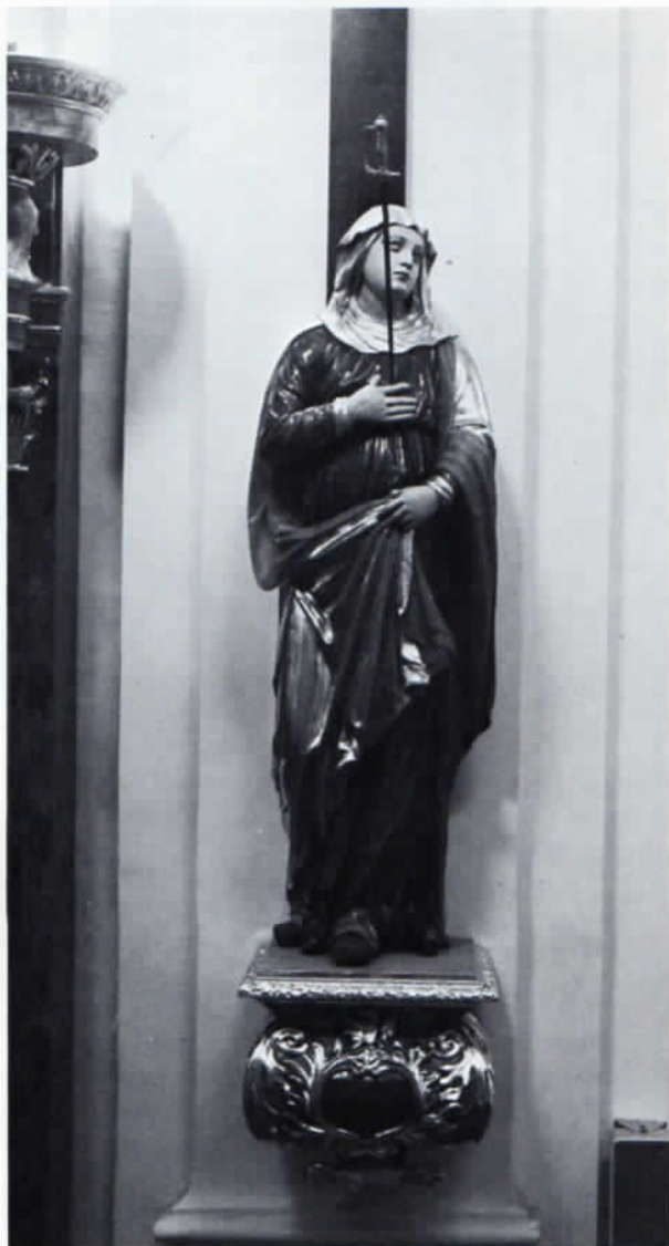
Pfarrkirche Kloster Indersdorf, Schmerzensmutter gegenüber der Kanzel.

Hier möchte ich kurz auf die Kosten für die Wiederherstellung eingehen. Es wurden für DM 94,50 Blattgold