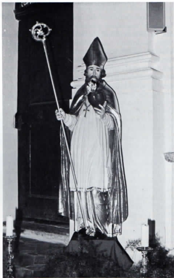
Pfarrkirche Kloster Indersdorf, Hl. Augustinus in der Nische am Westgiebel.

Bis auf die Orgel konnten damit die Restaurierungen im Langhaus abgeschlossen werden.