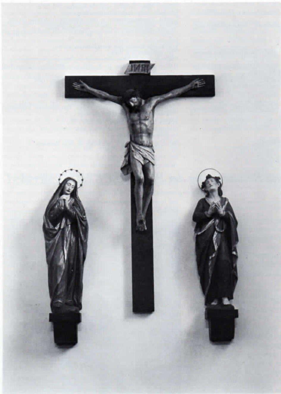
Pfarrkirche Kloster Indersdorf, spätgotische Kreuzigungsgruppe.