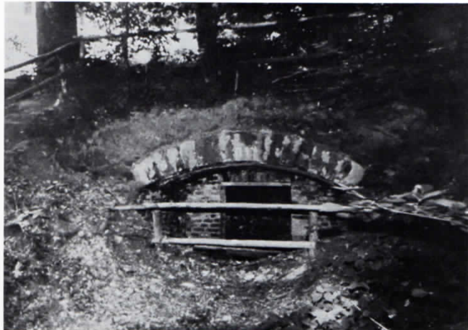
Oberberghausen, Backhaus beim ehemaligen Meßneranwesen.