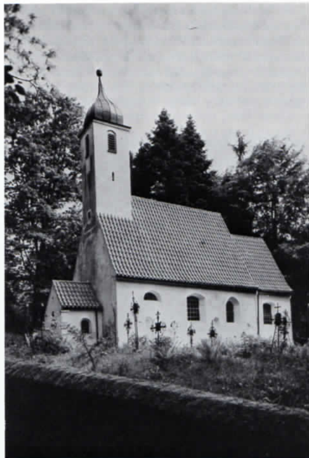
Kirche von Oberberghausen um 1950.

Die Pläne des Forstamts waren eindeutig. Ein Auszug einer Notiz des Freisinger Tagblatts 22 sagt darüber: »... Am nächsten Sonntag findet in der St. Klemenskirche dortselbst der letzte Gottesdienst statt. Bald darauf soll mit dem Abbruch des beinahe tausend Jahre alten, noch mit einem Holzplafond versehenen und im Jahre 1872 renovierten Gotteshauses begonnen werden. Gleichzeitig werden vier Bauernhöfe niedrigerissen und ein großes Kreuz, welches an der Stelle der Kirche zu stehen kommt, mag künftigen Geschlechtern die Stätte bezeichnen, an der einst eine ganze Ortschaft gestanden ...«. Daß es dazu nicht kam, ist der kgl. Verfügung vom 4. Oktober 1884 zu verdanken, in der es u. a. heißt: »... wird genehmigt, daß das bewegliche und unbewegliche Vermögen der Kirchenstiftung Oberberghausen mit Einschluß des Areals der Kirche und des Friedhofs in das Eigentum der Pfarrkirchenstiftung Wippenhausen übergeht, wogegen die letztere die Kosten für die nach Oberberghausen gestifteten und von nun an in der Pfarrkirche zu Wippenhausen abzuhaltenden Gottesdienste zu betreiben und die Kirche von Oberberghausen in gut baulichem Zustand zu erhalten hat. Jedoch darf für letzteren Zweck die Pfarrkirchenstiftung Wippenhausen nicht höher in Anspruch genommen werden, als es die Reste des von der Nebenkirchenstiftung Oberberghausen überkommenen Vermögens gestatten. Über das Vermögen letztgenannter Kirche ist alljährlich gesonderte