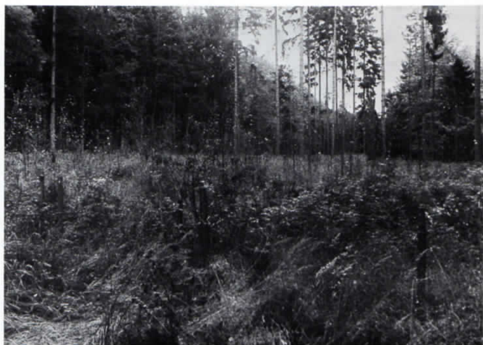
Oberberghausen, heutige Reste des Salicetums .