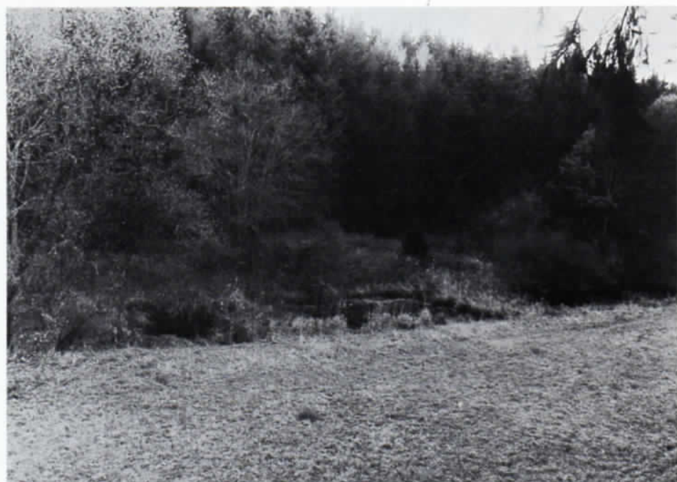
Oberberghausen, der künstlich angelegte Weiler.

Angesichts dieser Größenordnung war es nicht weiter verwunderlich, daß man mit dem Gedanken spielte, rationelle Schälbetriebe einzurichten. Selbst der Bau einer Korbflechter-Schule wurde als notwendig angesehen, die Verhandlungen darüber mit der Stadt Freising gerieten 1884/1885 in eine heiße Phase. Schon stellten sich »namhafte Sachverständige der Korbflechterei« zur Verfügung. 31 Die Finanzierung schien gesichert. Bei einem Verkaufswert von 20–25 Mark pro Zentner geschälten Weidenmaterials blieb nach Abzug der Ernte- und Schälungskosten (ca. 5,- Mark/Zentner) ein theoretischer Reinerlös von 15,- bis 20,- Mark/Zentner, für die