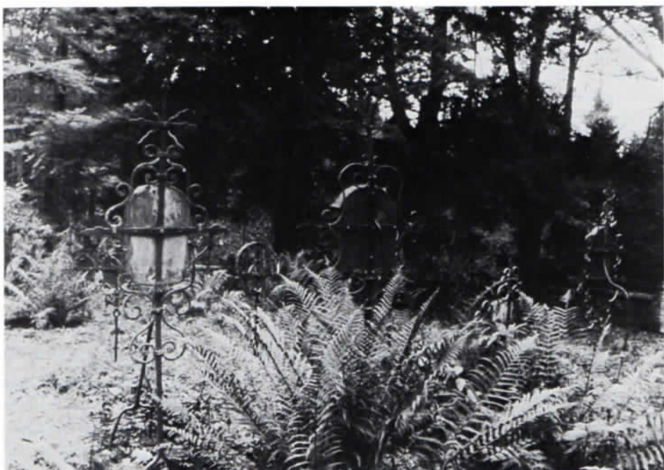
Oberberghausen, Friedhof im Sommer 1985.