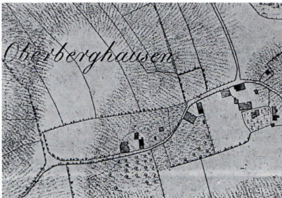
Oberberghausen nach dem Katasterplan von 1810.