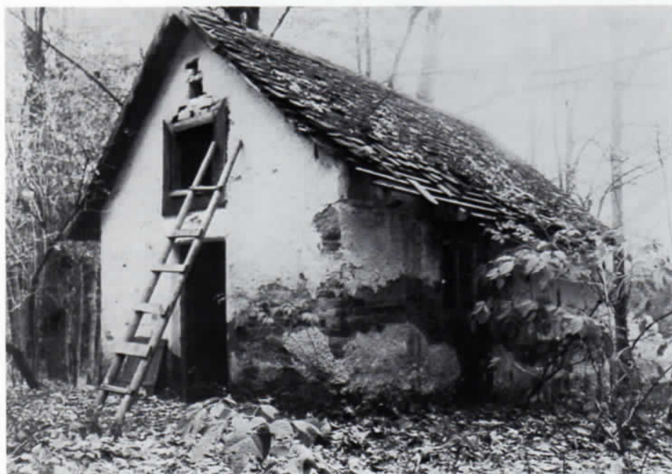
Oberberghausen, ehemaliges Waldhüterhaus.

Josef Hofmiller berichtet in seinem Aufsatz »Das Idyll Oberberghausen« 41 sinngemäß, die Bauern seien in die Stadt gezogen und dort verdorben. Ein ehemaliger Forstangestellter, der noch einige der an den Verkaufsverhandlungen beteiligten Personen selbst gekannt hat, behauptete das Gegenteil. Was geschah tatsächlich mit den vier Bauernfamilien? Zunächst einmal ist vielleicht von Interesse, wie seinerzeit die Öffentlichkeit über das Schicksal der Bauern informiert wurde. Da heißt es u. a. (Freisinger Tagblatt) 42 : »... Die Leute kauften sich anderwärts an, konnten es auch ganz gut, da sie bei der Ablösung vom Staat 3,- Mark/Dezimale erhalten hatten...«. Obwohl dieser Wert mit dem in den Kaufverträgen vereinbarten übereinstimmt, sagt er weder etwas über den amtlichen Schätzwert der Grundstücke noch über die Hypothek-Belastung der Anwesen aus. Insofern wurde der Öffentlichkeit suggeriert, daß diese 3,- Mark/Dezimale den Bauern zum Neuankauf verfügbar waren. Aufgrund der anfangs ermittelten Reinerlöse, die die Leute letztlich für ihr veräußertes Eigentum erhielten, konnte