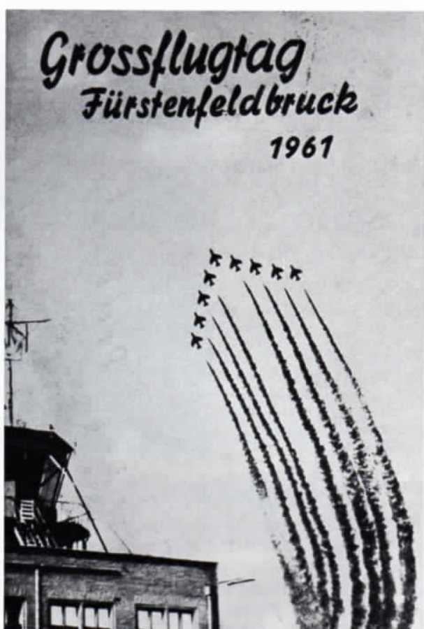
Anlässlich des Grossflugtages 1961 in Fürstenfeldbruck herausgegebene Bildpostkarte.

Eine Lichtdruckkarte ist auch die Ansicht (Abb.) vom Huberschen Gut Holzhausen. Während die Karte selbst etwa 1910 hergestellt worden sein dürfte, datiert der Poststempel erst vom 10. 1. 1938. Hier ist die Szenerie vor dem Anwesen noch besser erkennbar: Die Hofbesitzer, ihre Familienangehörigen und Diensten wurden vom Photographen bei solchen Aufnahmen mit Arbeitsgeräten und Gespannen gerne mit ins Bild genommen. Dadurch erfahren wir einerseits auch etwas über die zeitgenössischen Bewohner bzw. die auf dem Hofe Beschäf-