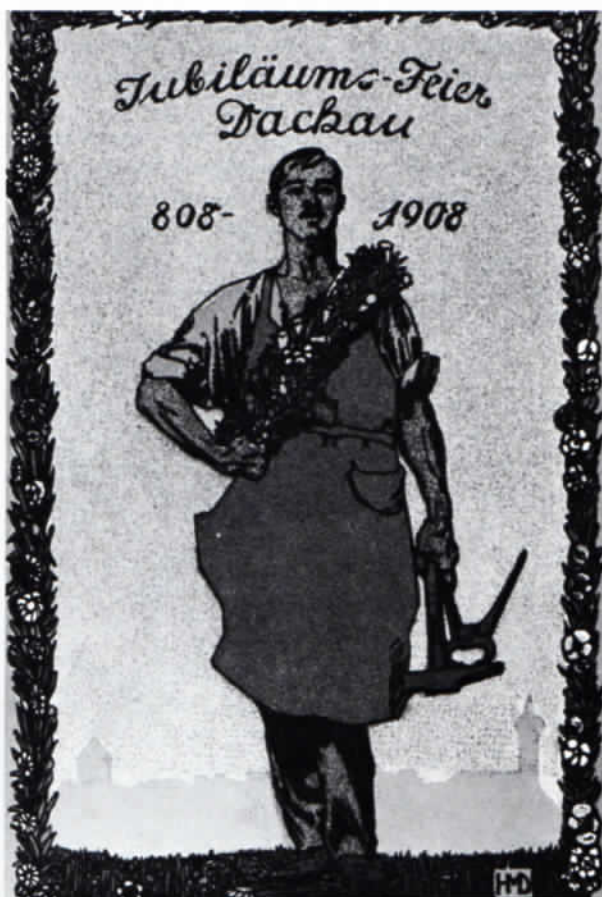
Festkarte des Magistrates von Dachau zur 1100jährigen Jubiläumsfeier 1908. Künstlerkarte von Hans Müller-Dachau.

Von den eigens für die Herstellung einer Ansichtskarte, eben meist auch zu einem besonderen Anlaß, entworfenen Künstlerkarten sind »Kunstkarten« zu unterscheiden. Dabei handelt es sich um Reproduktionen von Gemälden, Zeichnungen, Stichen usw.; die örtliche Motive zum Bildinhalt haben können. Gerade von den bekannten Künstlerkolonien in Dachau und Fürstenfeldbruck finden sich neben allgemeinen Motiven auch immer wieder detailreiche Darstellungen von hiesigen Landschaften oder Örtlichkeiten, die neben den ästhetischen Aspekten durchaus auch historische, zeitgeschichtliche oder volkskundliche Rückschlüsse zulassen. Einige besonders schöne Ansichten aus dem Amperland verdanken wir dem Brucker Maler Prof. Paul W. Keller-Reutlingen (1854–1920). Dazu zählt sicherlich auch das Bild von Schöngesing (Abb.) mit Blick auf das Amperthal. Das kleine Mädchen im Vordergrund bildet nicht nur eine wesentliche kompositionelle Komponente des Gemäldes, sondern verleiht ihm auch einen speziellen Charme, der das Bild von einer gewöhnlichen Land-