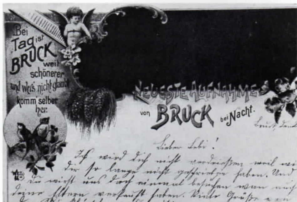
Scherzpostkarte von Fürstenfeldbruck (1903).

Es ist erstaunlich, welche Kuriositäten die Blütezeit der Bildpostkarte hervorgebracht hat: »Halt-gegen-das-Licht« stand auf Karten, in die durchscheinende Partien eingearbeitet waren; der Eindruck erleuchteter Fenster konnte beispielsweise so erzeugt werden. »Radium-Karten« (Markenzeichen: Radiana) leuchteten nach vorheriger Bestrahlung mit künstlichem Licht im Dunkeln. Beliebte waren auch »Klapp-Karten«, die im auseinandergeklappten Zustand meist ein landschaftliches Panorama zeigten. Nicht immer waren die Postkarten aus Papier, u. a. gab es »Holzkarten«. Eine dünne Holzplatte bildete das Material. Sog. »Reliefkarten« versuchten, von der abgebildeten Landschaft einen besonders plastischen Eindruck zu geben. Überhaupt war das Prägen, also das Herstellen einer halbplastischen Oberfläche, ein gern verwendetes Gestaltungsmittel. Auch Karten mit Stoff-