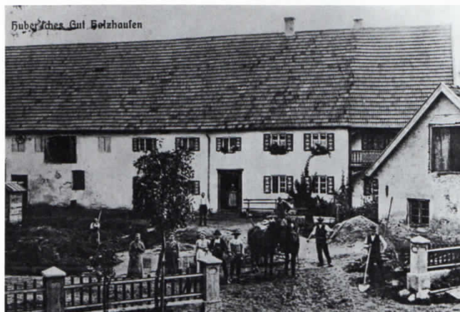
Bildpostkarte vom Huber'schen Gut in Holzhausen (um 1910).

Ein technisch weniger aufwendiges und vor allem preiswerteres Druckverfahren verdrängte die Lithographie schon etwa im zweiten Jahrzehnt unseres Jahrhunderts: