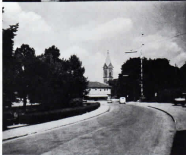
»Hauskarte« von Olching und Schwogerstraße 26 (Foto) von ca. 1965.