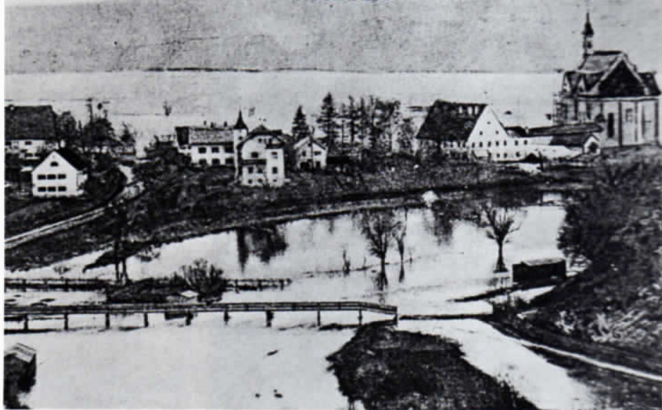
Anlässlich des Hochwassers in Grafrath im Jahre 1910 herausgegebene Bildpostkarte.