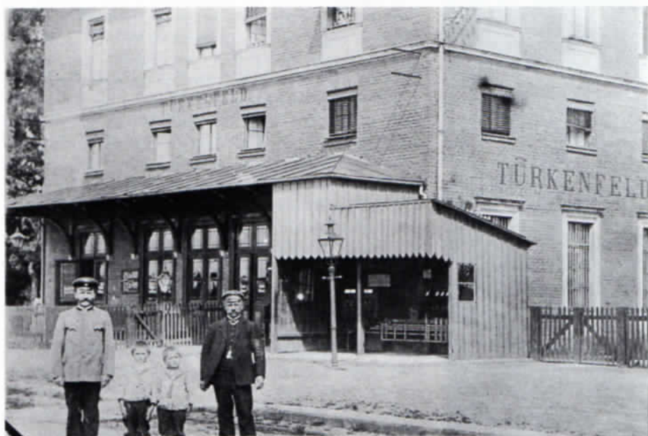
Bildpostkarte (Foto) vom Bahnhof Türkenfeld (1915).

Noch erstrebenswerter wäre es natürlich, wenn wieder vermehrt ganz persönliche, individuelle Ansichtskarten von einzelnen Häusern verwendet würden. Die Initiative des einzelnen wäre erforderlich, für die Herstellung solcher Karten zu sorgen, wie sie beispielsweise noch in den 60er Jahren verbreitet waren: Die eine Hälfte der Karte zeigte eine typische Ansicht des jeweiligen Ortes (Kirche, Marktplatz, Hauptstraße u. ä.), die andere ein einzelnes Haus. Wohl eher kleinere Fotoateliers waren in dieser Marktlücke tätig, zogen von Dorf zu Dorf, fotografierten Haus für Haus und warfen später in jeden Briefkasten ein »Muster« der eigens für das einzelne