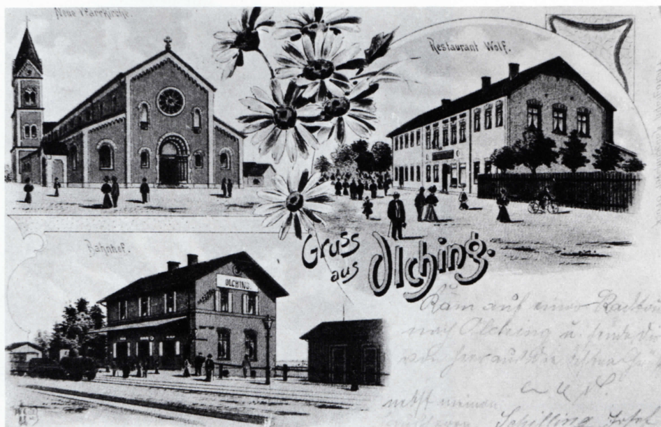
Bildpostkarte von Olching (1902).

Nachdem immer wieder lithographisch gedruckte Karten auch von sehr kleinen Dörfern auftauchen, kann man davon ausgehen, daß es um die Jahrhundertwende praktisch von jedem Ort im Landkreis wohl wenigstens eine Karte im Lithodruck gab. Zur Herstellung solcher Karten war es zunächst erforderlich, daß ein »Lithograph«