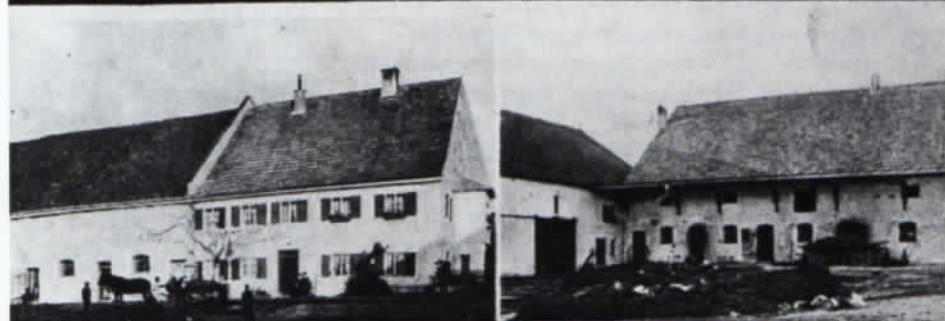
Bildpostkarte vom Angerhof bei Fürstenfeldbruck (um 1910).

applikationen wurden erzeugt, vor allem im Bereich der sog. Motivkarten, speziell bei Abbildung von Trachten und Mode. »Öldruck«-Karten sollten durch die reliefartige Gestaltung der Oberfläche eine möglichst vorbildgetreue Wiedergabe von Gemälden erreichen. Von allen größeren Orten gab es »Luna«-Karten, deren Bildseite metallisch glänzte. Besonders originell sind die »mechanischen Karten«, die bewegliche Teile haben; eine Spielart davon war die »Postkarte mit Drehscheibe« (Druckvermerk: In fast allen Kulturstaaten geschützt), wie sie beispielsweise von Markt Indersdorf existiert (s. Abb.). Die Karte zeigt eine Gesamtansicht des Ortes (Aufnahme ca. 1910); über dem Ort schwebt ein Fesselballon, dessen Ballonhülle zum »Guckfenster« wird: eine in die Karte drehbar eingesetzte Kartonscheibe bietet vier verschiedene Ansichten des Marktes, u. a. die Steiger'sche Brauerei und den Marktplatz.