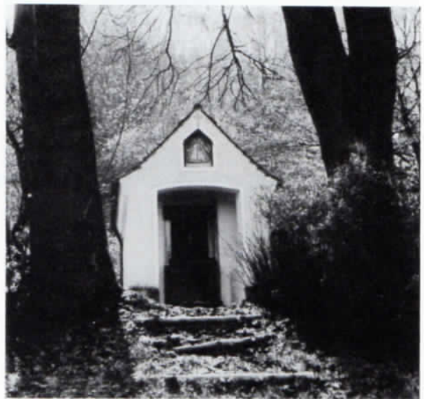
So bietet sich die Emmeringer Marienkapelle dem Besucher heute dar. Am Giebel das Motivbild zu den Ereignissen von 1635.

Heute legen die Wallfahrer die etwa 35 km weite Strecke nach Aufkirchen in modernen Bussen zurück. Schon bei