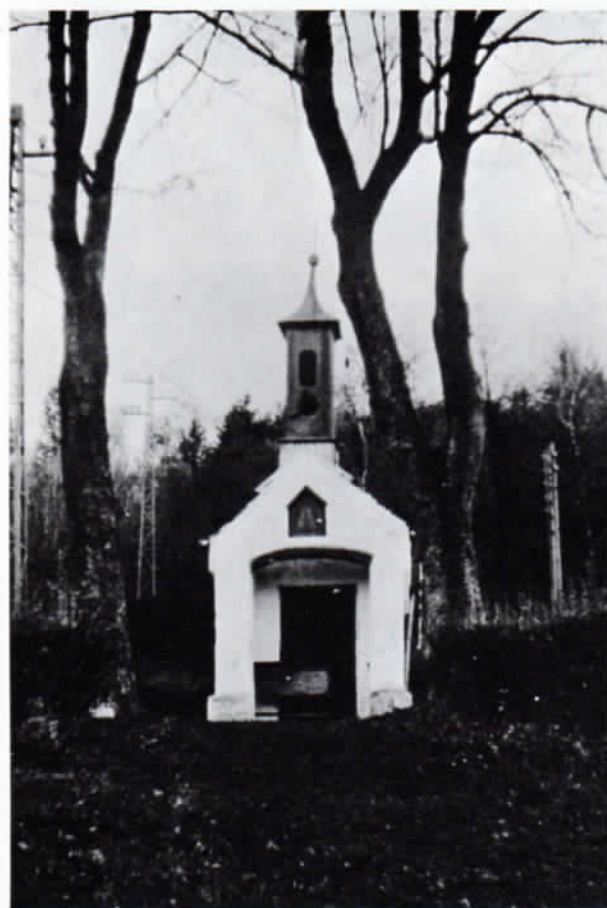
Diese Aufnahme der Emmerring Marienkapelle entstand um 1930. Damals zierte noch ein Holztürmchen den kleinen Sakralbau.

Nach dem Zweiten Weltkrieg befand sich das Fresko wieder in einem sehr schlechten Zustand und hätte dringend einer Erneuerung bedurft. 1947 setzte sich der Fürstendruck Hotelier Ludwig Weiß vergeblich für eine damals noch mögliche Restaurierung ein. Durch den