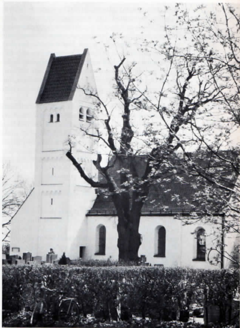
Die alte Pfarrkirche St. Georg in Hebertshausen im Frühjahr 1985.