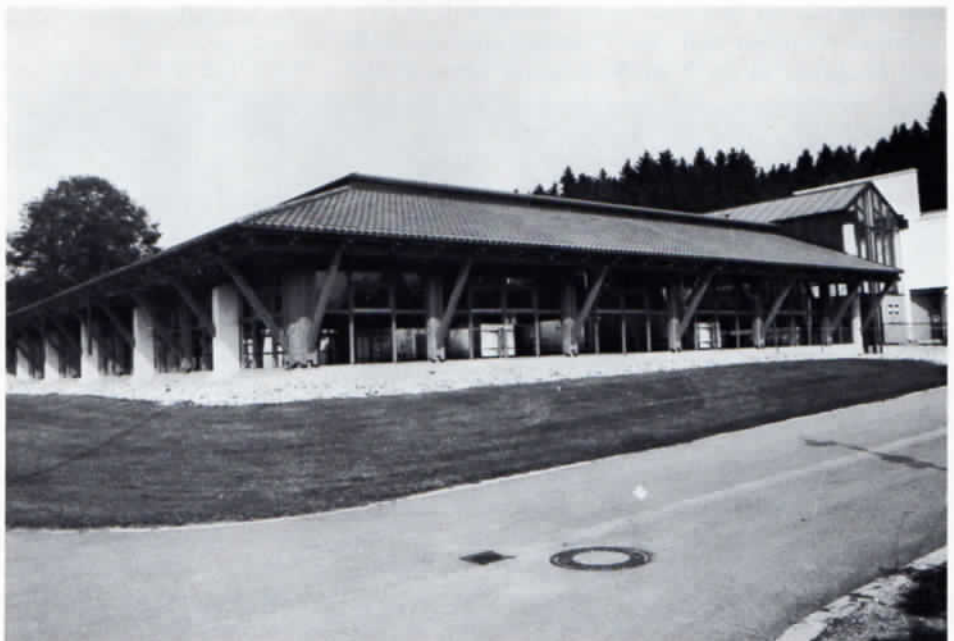
Die neue Turnhalle in Hebertshausen.