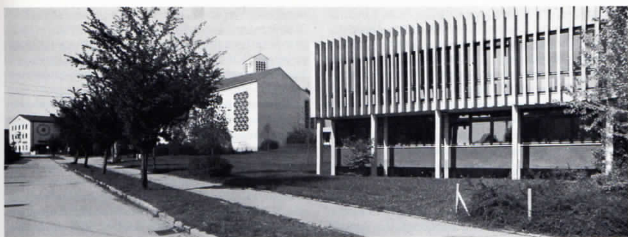
Rathaus und neue Pfarrkirche in Hebertshausen. Links im Hintergrund Landgasthof Herzog, 1974.