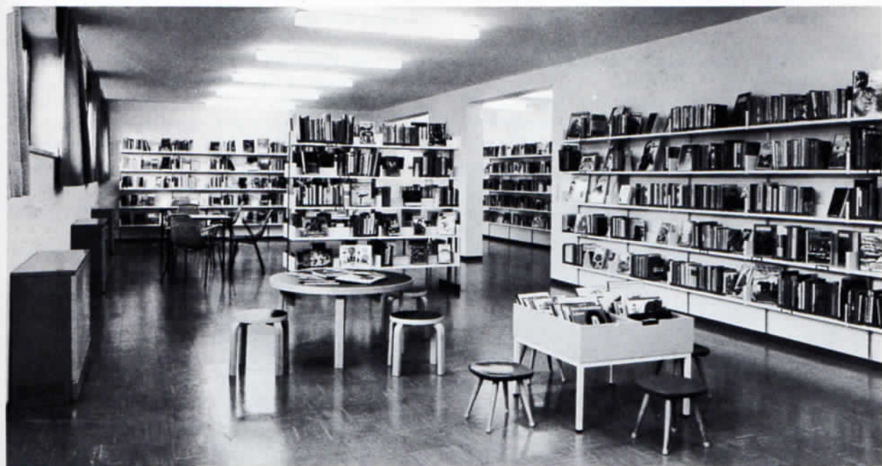
Gemeindebücherei in Hebertshausen, 1971.

Im Winter 1974 wurde der Schulpavillon errichtet. Trotz Umbau des Gemeindehauses in Ampermoching und der Belegung aller verfügbaren Klassenzimmer in den Schulhäusern in Ampermoching, Biberbach, Großsinzemoos und Prittlbach konnten die Schüler aus dem großen Schulverband nicht untergebracht werden. Der Pavillon mit vier Klassen konnte einen Teil der Grundschule aufnehmen und einen regelten Unterricht gewährleisten. Die Bemühungen des Schulverbandes Bergkirchen wieder die Selbständigkeit zu erwirken, hatten 1976 Erfolg. Die Gruppe Bergkirchen wurde ab dem Schuljahr 1976/77 vom Schulverband Hebertshausen in beiderseitigem Einvernehmen und zu beiderseitiger Erleichterung