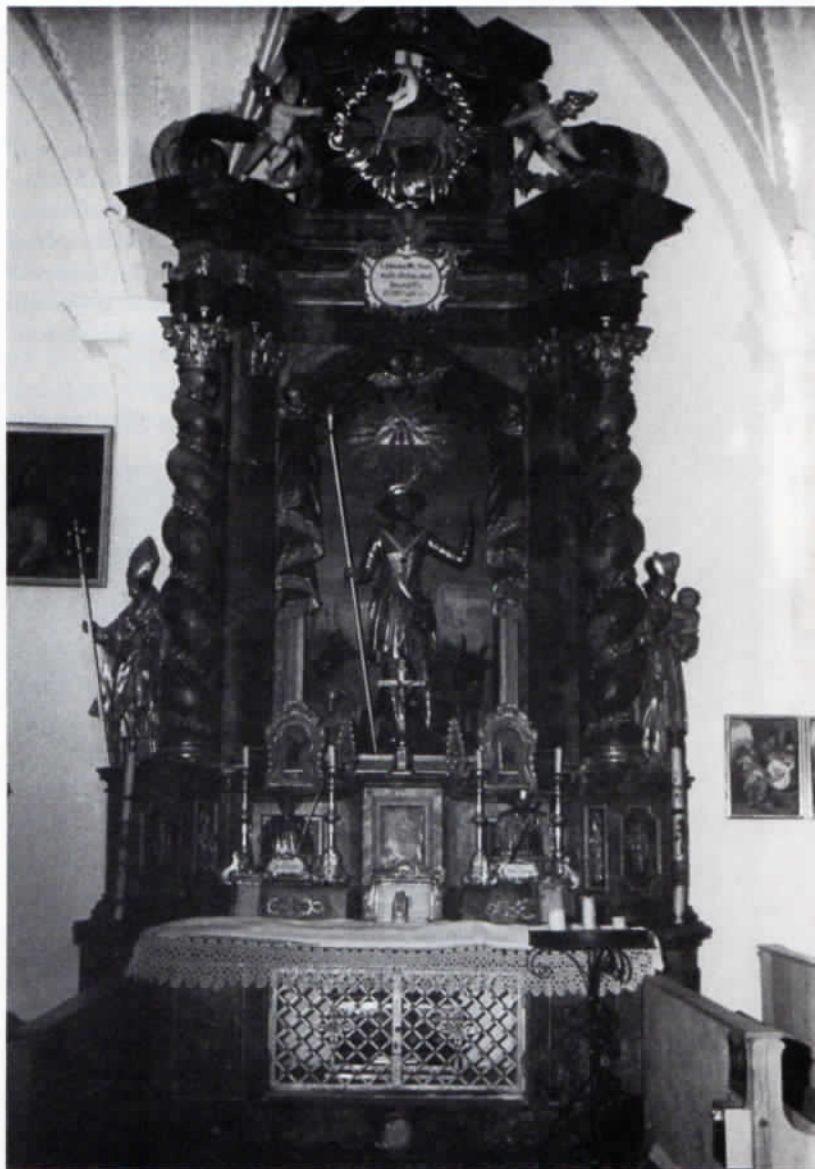
Der Eberhardsaltar in der Tüntenhauser Kirche wurde 1734 vom Freisinger Hofbildhauer Anton Mallet geschaffen.

In der Tüntenhauser Fialkirche finden wir leider nur noch wenig vor, was sich auf unseren heiligen Hirten