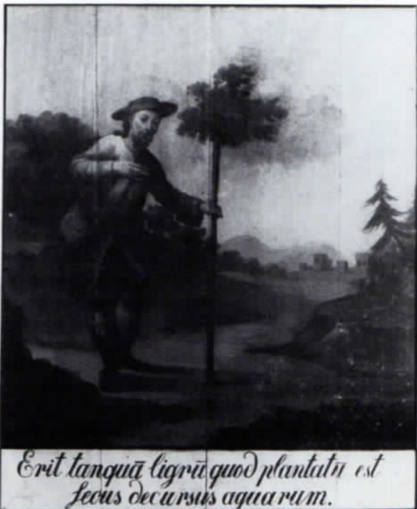
3. Bild: Aus dem Hirtenstab entspringt die Eberhardslärche.

Unter dem Thema: »Ossa ejus visitata sunt« – »Seine Gebeine sind besucht worden« (Ecclesiasticus 49,18) ist