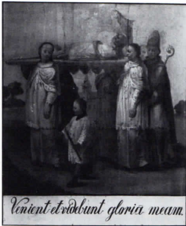
2. Bild: Anlässlich seiner Heiligsprechung werden die Reliquien Eberhards in das Kloster Neustift überführt.

suchung, bis die »unvordenkliche Verehrung« Eberhards amtlich festgestellt war. Schließlich wurden die Gebeine des nun wirklich Heiligen Eberhards in einer dreifach versiegelten Truhe in aller Stille am 30. März 1734 nach Tüntenhausen überführt und wieder beigesetzt.