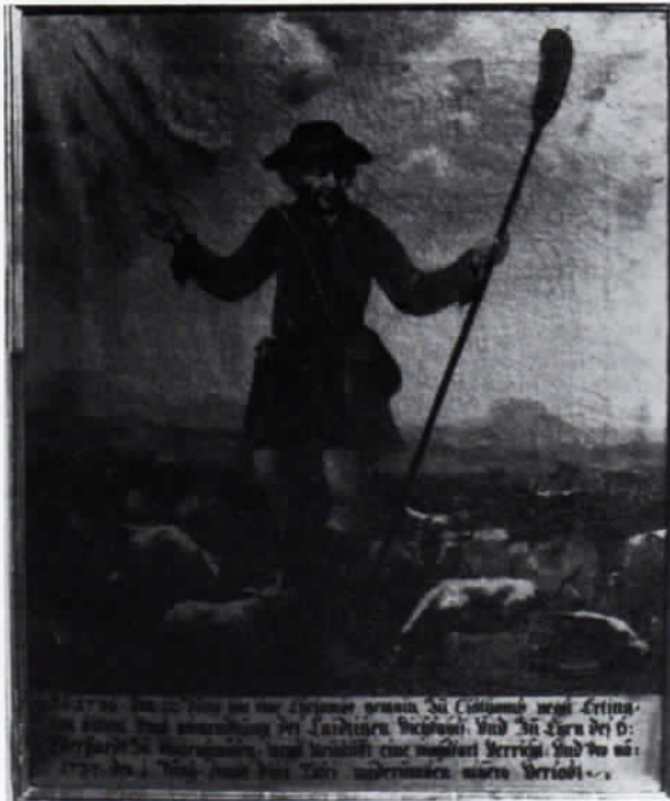
Die einzige, heute noch erhaltene Votivtafel in Tüntenhausen wurde 1736 von der Gemeinde Klettham bei Erding gestiftet.