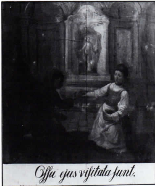
4. Bild: Ein Bauernpaar in Freisinger Tracht entnimmt heilkräftige Erde aus dem Eberhardsgrab.

Es war aber nicht Einbildung, die die Bauern dazu verleitete, die Erde fürs Vieh zu verwenden. Die Erde in Tüntenhausen ist tatsächlich heilkräftig, wie Bodenuntersuchungen einwandfrei ergeben haben. Sie besitzt einen hohen Anteil des Tonminerals Montmorillonit, durch dessen Auswaschung man Bolus alba, also Heilerde, erhält. Sie findet Anwendung bei Kälberruhr und infektiösen Durchfällen von Groß- und Kleinvieh.