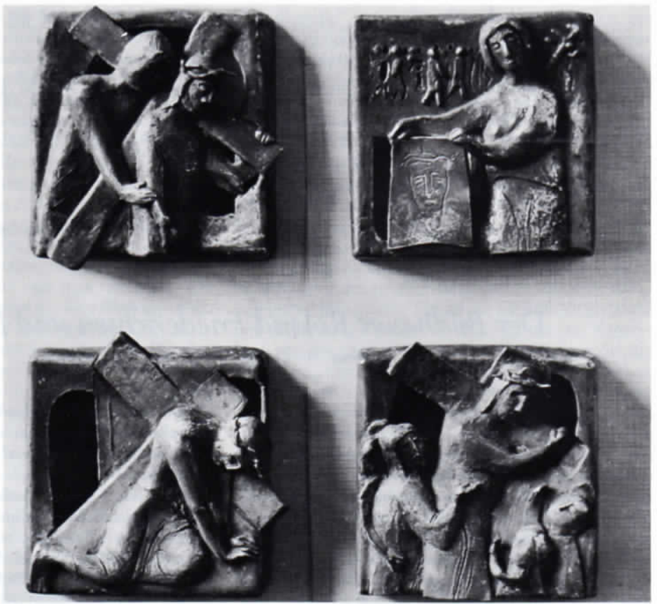
Abb. 2: Roland Friederichsen: Kreuzweg-Stationen 5, 6, 7 und 8 in Hl. Kreuz, Dachau-Ost.

bei Büsten nicht darum, nur die absolute Ähnlichkeit mit dem Dargestellten durch viele kleine und möglicherweise verwirrende Einzelheiten zu erzielen. Er will eine Art von geistigem Überblick geben. In dieser Weise soll auch die Thiemann-Büste verstanden werden. Diesem feinen Werk, einem vorzüglichen Bronzeuß, war übrigens ein schlechtes Los beschieden. Nach dem Tode Thiemanns schenkte die Witwe des Künstlers die Büste der Stadt Dachau, die sie in einer neu errichteten Anlage in Dachau-Ost aufstellte, welche dann den Namen »Thiemann-Anlage« erhielt. Von Anfang an war sie der unerklärlichen Zerstörungswut von Rowdies ausgesetzt. Nachdem sie zahllose Male verschmiert, mit Flaschen beschlagen worden war, wurde sie im Herbst 1982 sogar von ihrem schönen Natursteinsockel heruntergerissen. Glücklicherweise ging sie dabei nicht vollständig verloren. Sie wurde von der Stadt Dachau in Verwahrung genommen und nicht mehr aufgestellt. Carl Thiemann, einer der bedeutendsten Dachauer Künstler, hat damit sein Denkmal, die Stadt Dachau eine ihrer Sehenswürdigkeiten verloren.