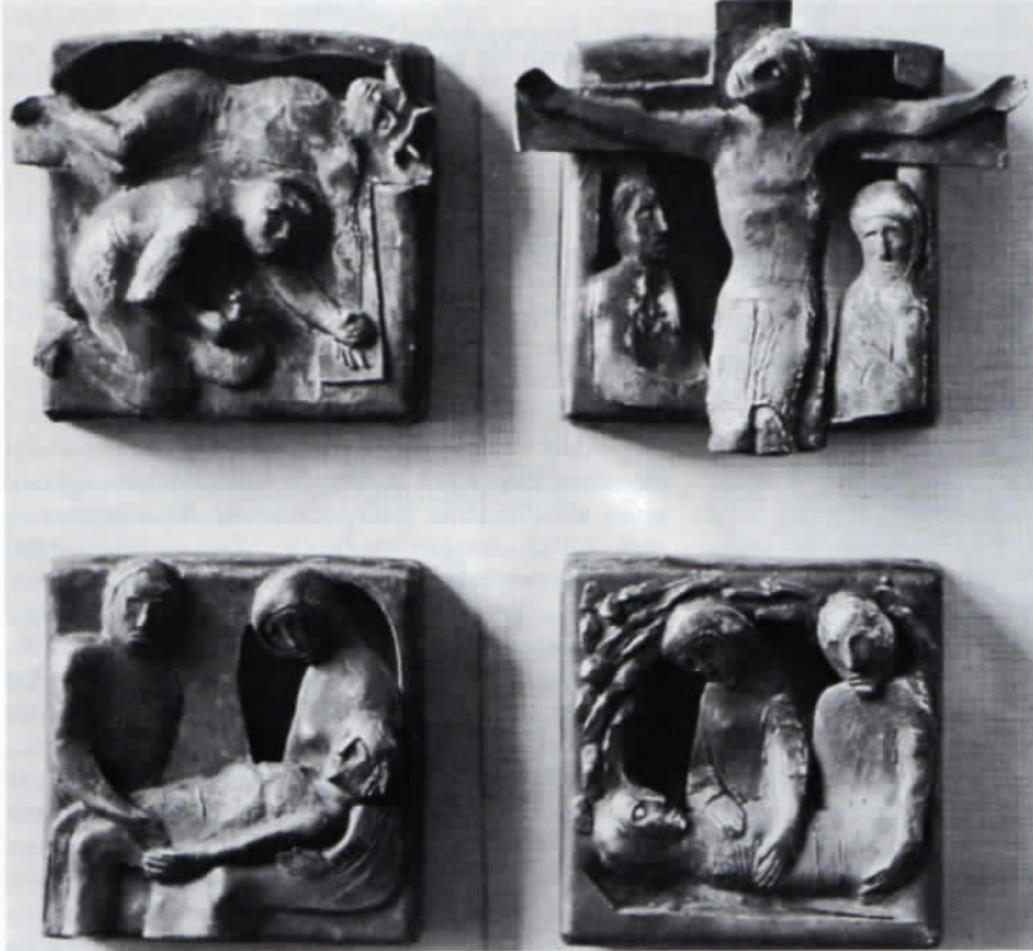
Abb. 3: Roland Friederichsen: Kreuzweg-Stationen 11, 12, 13 und 14 in Hl. Kreuz, Dachau-Ost.

Kreuzstamm schiebt. – Rechts oben: Die hl. Veronika mit dem Schweißstuch, das die Züge Jesu trägt, die Darstellung ist äußerst klar und einfach. – Links unten: Jesus stürzt unter dem Kreuz. Wiederum, dem Kreuz folgend, diagonal komponiert, vermag es der Künstler, die ganze Figur Christi in dem quadratischen Raum unterzubringen. – Rechts unten: Jesus und die Frauen. Die Hauptgestalt, Jesus, im Größenmaßstab bevorzugt.