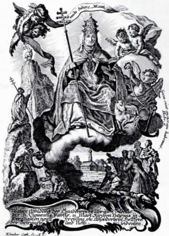
Abb. 3: Kupferstich des hl. Clemens von Oberberghausen, von Klauber in Augsburg gestochen, um 1760.

Die beiden Kupferstiche sind nur zu verstehen, wenn man Leben und Legende des heiligen Papstes Clemens I. kennt. 15 Der römische Kaiser Trajan (53–117 n. Chr.) ließ den Papst auf die Halbinsel Chersones (heute Sewastopol auf der Krim) verbannen. Dort mußten über 2000 Christen Erz schürfen und Steine brechen. Wie den geknecht-