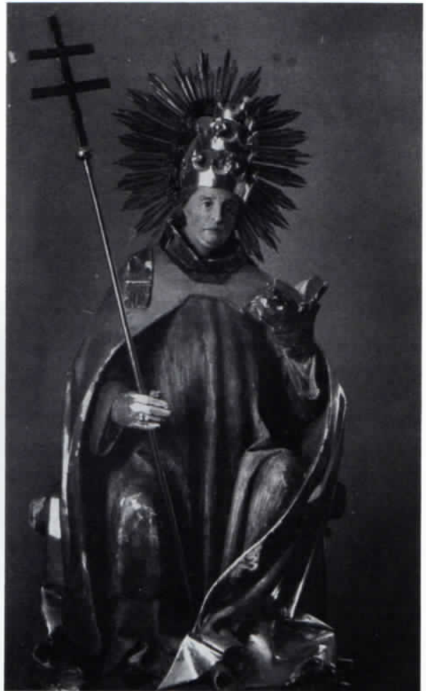
Abb. 4: Hl. Clemens, Gnadenbild von Oberberghausen, Holzplastik um 1490.