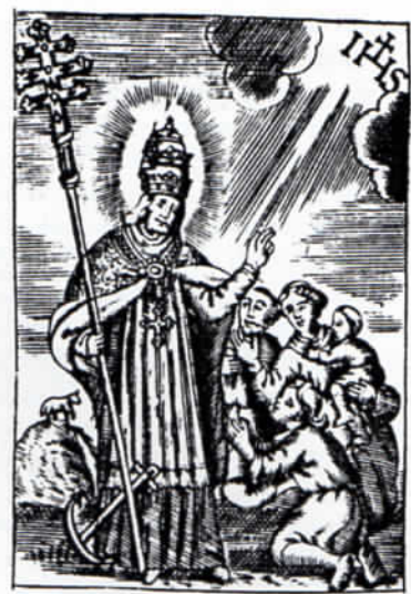
H: Clementis Papsts u: Mart: || ein Vatter der Armen und || Kirchen Patron, in Perg/Hausen ||«

Ein wesentlich qualitativvolles Blatt hat Klauber in Augsburg um 1760 gestochen (Abb. 3) 14 . Auf einer Wolkenbank thront das Gnadensbild der Oberberghäuser Kirche. Zwei Engel blicken neugierig über die Schulter des Papstes in das aufgeschlagene Buch. Rechts daneben kauert ein Schaf, dahinter hält ein Engelchen den Anker