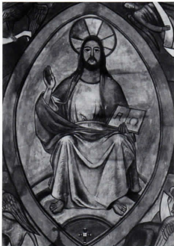
Der zuerst umstrittene thronende Christus in der Apsis der Pfarrkirche Olching von Josef Bergmann.