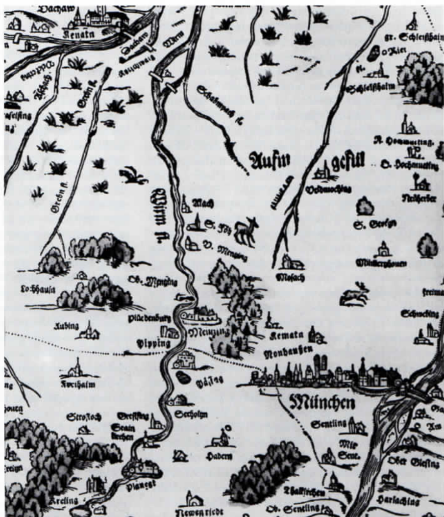
Ausschnitt aus den Bayerischen Landtafeln von Philipp Apian 1568 mit der punktiert eingetragenen Landgerichtsgrenze zwischen dem Landgericht Dachau und dem Landgericht Starnberg. Rechts oben ein kleines Stück der Grenze zwischen dem Landgericht Dachau und dem Landgericht Kranzberg. Aus der Karte wird deutlich, daß München am linken Isarlauf vom Landgericht Dachau umschlossen wurde.

bürger kennt: er ist auf unseren 50-Mark-Scheinen abgebildet!