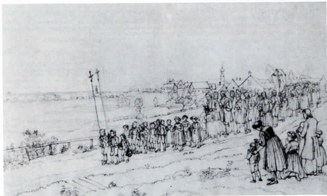
Lorenz Quaglio: Bittgang in Mittersending. Bleistift, 262 x 410 mm. Die offensichtlich nach Maria Thalkirchen gehende Prozession kommt aus einem Dorf des Landgerichts Dachau. Die Bauern und Bäuerinnen tragen die sogenannte Dachauer Tracht.

An die Hauptmannschaft Neuhausen schloß die Hauptmannschaft Moosach wie vorstehend beschrieben an. Sie ging nicht sehr deutlich abgegrenzt über in die kurfürstliche Hofmark Nymphenburg, denn die um die Schloßanlagen herum entstandenen Anwesen waren landgrichtlich und unterstanden der Hauptmannschaft Moosach. Zum kurfürstlichen Schloß Nymphenburg gehörten der Lust- und der Küchengarten, eine Klausen, Jägerhaus und Hundezwinger, ein Treibhaus, die Schwaige sowie die Amalienburg, die Badenburg und die Pagodenburg. Nymphenburgs westliche Nachbarschaft bildete die geschlossene kurfürstliche Hofmark Menzing, dazu gehörten das kurfürstliche Schloß Blütenburg mit Ökonomie, Zehentstadel und Allacher Forst, dann die Dörfer Obermenzing (43 Anwesen) und Untermenzing (34 Anwesen) sowie der Weiler Pipping (5 Anwesen). Das bis ins 12. Jahrhundert zurückgehende Schloß Menzing, 1432 erst-