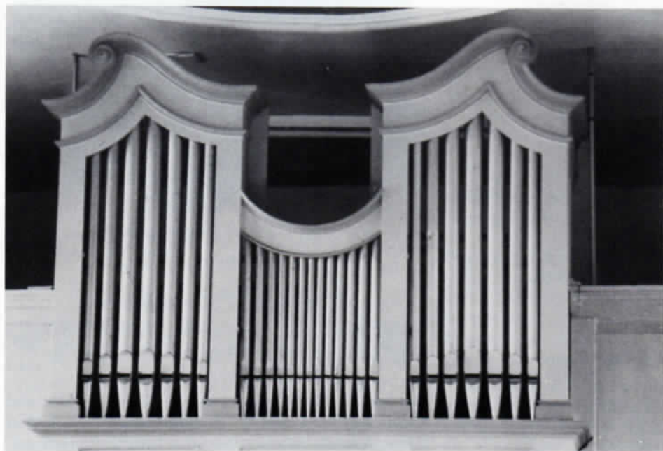
Von der 1888 durch Georg Beer aus Erling aufgestellten Orgel in Unteraltling hat sich nur mehr das Brüstungsgehäuse erhalten.

Der heutige Bestand des Landkreises Fürstentfeldbruck – den wir heuer in Etappen befahren hatten und wegen der