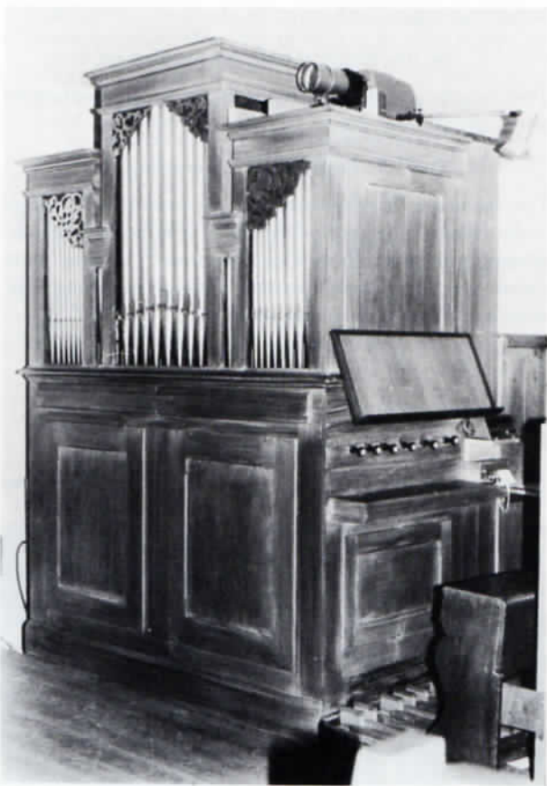
Die Orgel in Unterschweinsbach gehört noch der Zeit um 1860 an.