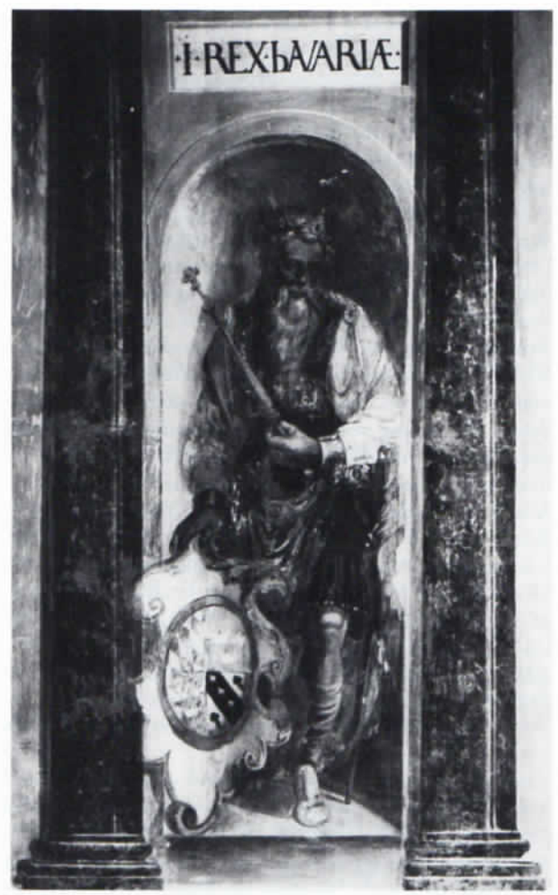
Abb. 4: Bavarus im Kapellengang der Landshuter Stadtresidenz.

Fürstenbilder bestätigt unsere Annahme, denn die Übergabe des Dreikronenbanners an Arnold von Scheyern wird mit folgenden Worten kommentiert: »Nyhm vo meiner handt Norkaw daß edl lanndt«. 40