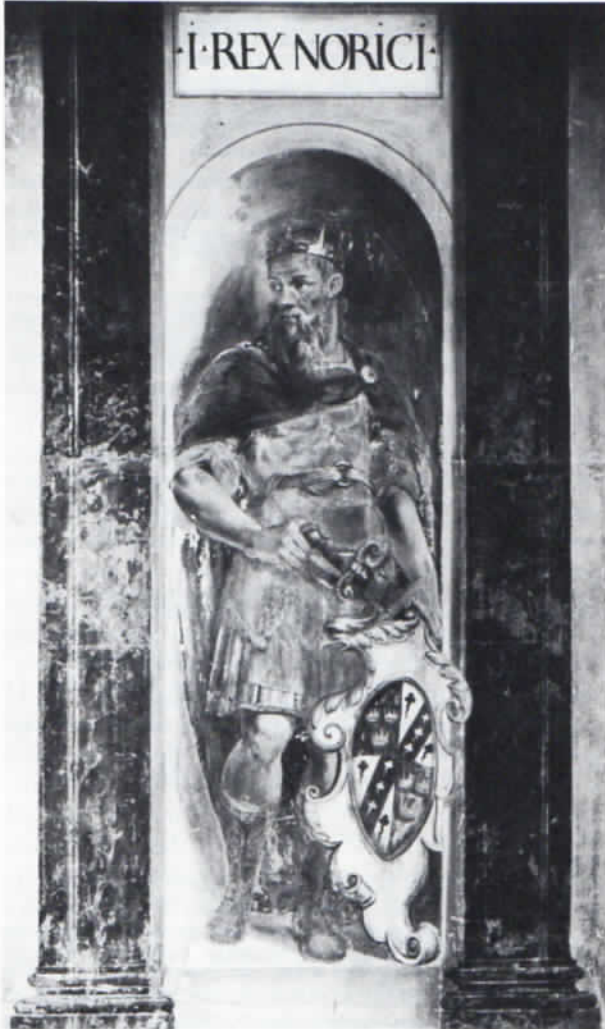
Abb. 3: Norix im Kapellengang der Landshuter Stadtresidenz.

Norix hat dem Nordgau nicht nur seinen Namen, sondern auch sein Wappen gegeben. Mit dem Dreikronenwappen werden in den gemalten Stammbäumen der durchgesehenen Handschriften alle Nachfolger des Norix als Regenten des Nordgaus gekennzeichnet. Auch in dem Zyklus der wittelsbachischen Fürstenbilder von Scheyern, der, Ende des 14. Jahrhunderts wohl als Freskomalerei im Auftrag Herzog Friedrichs von Bayern-Landshut entstanden, 1624/25 auf Tafeln übertragen wurde, kommt den drei Kronen zweifellos diese Bedeutung zu. Eine 1730 entstandene Nachzeichnung des ersten der