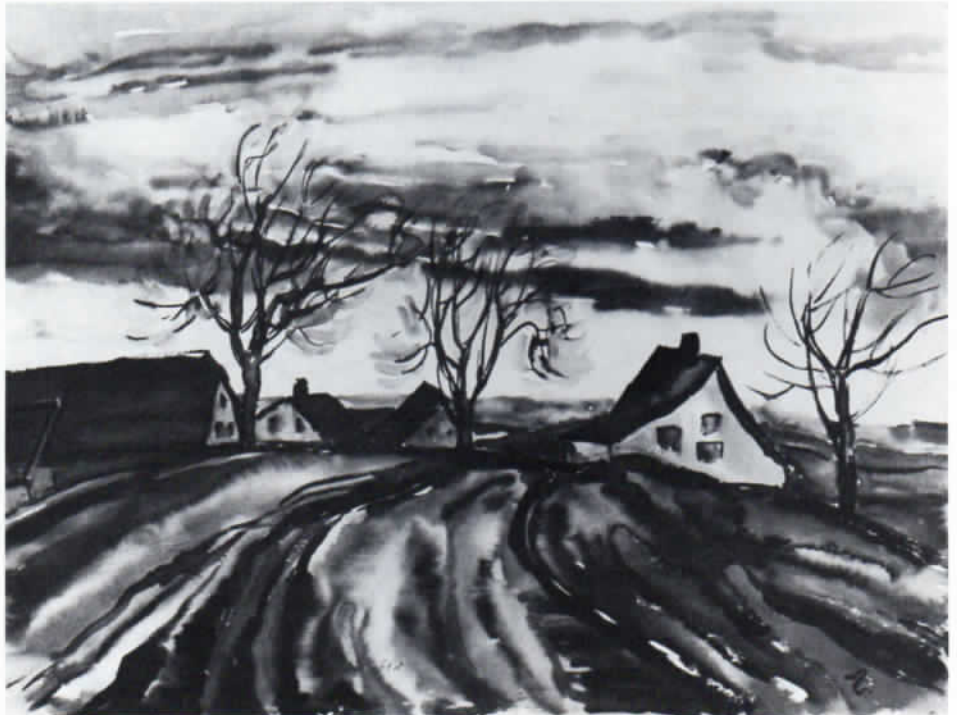
Abb. 4: Emi Fuchs-Hussong (gez. N): Feldweg bei Webling (1948), Aquarell, 59 x 44,5 cm.

dabei zu ganz erstaunlichen Schilderungen des Wetters (Abb. 4). Schließlich hat sie auch gern Blumen gemalt. Blüten, im eigenen Garten gepflückt, ordnete sie in schlichte Vasen und stellte sie dar (Abb. 5). Die Malweise von Emi Fuchs-Hussong ist großzügig und »modern« insofern, als sie sich nicht bei Details aufhielt. Sie meisterte das »Weglassen« und beendete eine Arbeit bewusst, statt das zu tun, was Dürer »kläubeln« nannte, das heißt: die immer wieder erneute Vornahme einer bestimmten Stelle. Und doch, trotz aller zeitlichen Entfernung, gehört auch sie noch zum Gefolge unseres größten deutschen Meisters, indem auch sie die Natur als Quelle aller Kunst