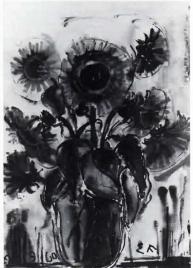
Abb. 5: Emi Fuchs-Hussong (gez. EF): Sonnenblumen (1960), Aquarell, 60 x 44 cm.

Die Jahre 1927 bis Ende 1930 verbrachte das junge Paar in Rußland, wo Fuchs an einer geheimen Flugzeug-Erprobungsstelle tätig war. In den folgenden Jahren in Darmstadt vertiefte Emi ihre Sprachkenntnisse (sie sprach fließend Englisch, Französisch und auch Italienisch) und holte das Abitur mit Russisch als Fremdsprache nach. Wie sehr sollte ihr diese große Sprachbegabung bei ihren späteren Kunstreisen mit ihrem Gatten, die sie durch ganz Europa führten, zustatten kommen!