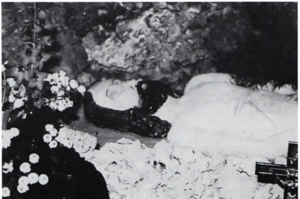
Abb. 4: Der Heilig-Grab-Christus in den »Grüften« des Aiterbacher Kalvarienberges von Karl Huber, Freising.

Die auf Holz gemalte Votivtafel (h: 23,8 cm, b: 33,9 cm) ist leider nicht datiert (Abb. 3). Unten rechts ist »EX VOTO« zu lesen, daneben grasen eine Stute und zwei Fohlen. Dahinter ist der Kalvarienberg abgebildet: Die Kreuze haben keine Blechdächer mehr, die Figuren von