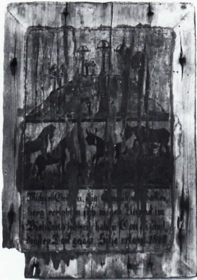
Abb. 1: Votivtafel mit Kalvarienberg in Aiterbach aus dem Jahre 1848.

Dem Besucher des kleinen Dorfes Aiterbach im Landkreis Freising bietet sich ein idyllischer und zugleich ergreifender Anblick: an der Ostseite des Ortes, der Kirche des heiligen Brictius fast gegenüber, erhebt sich ein sanfter Hügel. Umsäumt von Zypressen führen steinerne Kreuzwegstationen, die kleine Blechtürchen zum Öffnen haben und gemalte Bilder des Leidensweges Jesu zeigen, von