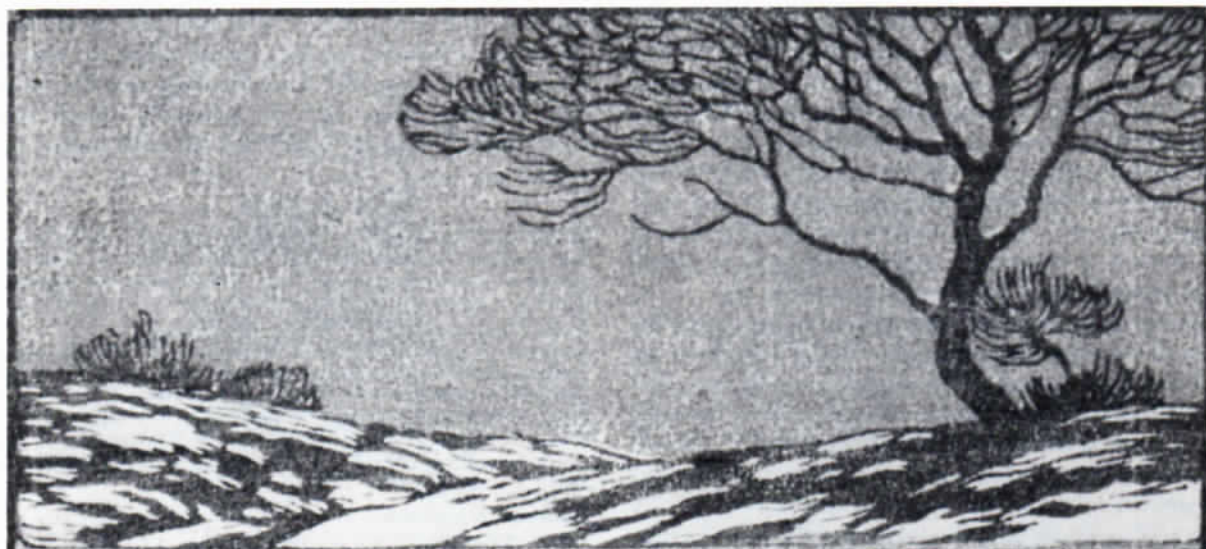
Abb. 1: Carl Thiemann: Februar. Farbholzschnitt, 72 x 160 mm (Merx 45 F).

zunächst einen kaufmännischen Beruf auszuüben, konnte endlich dann auch aufgrund von Stipendien Maler und Grafiker werden, besuchte kurz die Kunstakademie zu Prag und besaß ein Atelier in dem Prag nahe gelegenen Dorf Libotz. Als er ganz zufällig 1906 in den Straßen von Prag dem Kameraden begegnete und sich herausstellte, daß Klemm ohne festes Domizil war, lud Thiemann ihn zu sich nach Libotz ein. 1908 erfolgte ein Ortswechsel der beiden Künstler, sie übersiedelten nach Dachau.