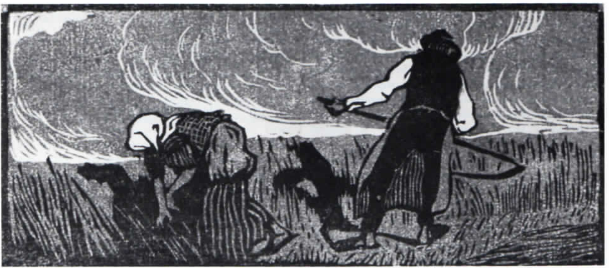
Abb. 3: Walther Klemm: August. Farbholzschnitt, 72 x 163 mm.

jene Baumgruppe zum Inhalt hatten (Abb. 1, 2). Auch die Technik dieser Blätter ist überaus fein und zart, man merkt, daß Thiemanns Schaffen seither der Radierung gegolten hatte und sich erst langsam zu dem linear so viel kräftigeren Holzschnitt hinfand. Aber die Zartheit paßte hierher, insofern es sich um keine bestimmten, sondern meditativ erfundene Landschaften handelt. Klemm hingegen wartete bereits mit einem festgefügteten Linienholzschnitt auf (Abb. 3, 4). Seine Darstellungen auf dem Felde arbeitender Menschen haben eine echte Sicherheit. Gerade diese Verschiedenheit Thiemann/Klemm erweist sich als äußerst reizvoll und belebend bei der Aneinanderreihung der Blätter für den »Kalender für das Jahr 1907«, als die Welt noch nichts wußte von dem Schrecken des Ersten Weltkrieges, der doch so dicht bevorstand.