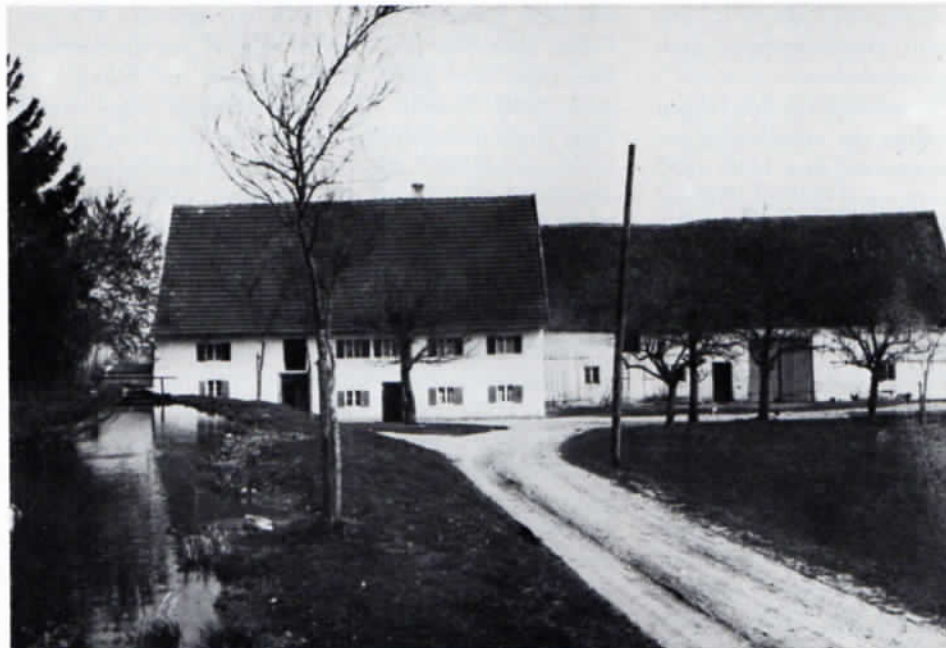
Die alte Unterermühle in Alling in der Zeit um die Jahrhundertwende.