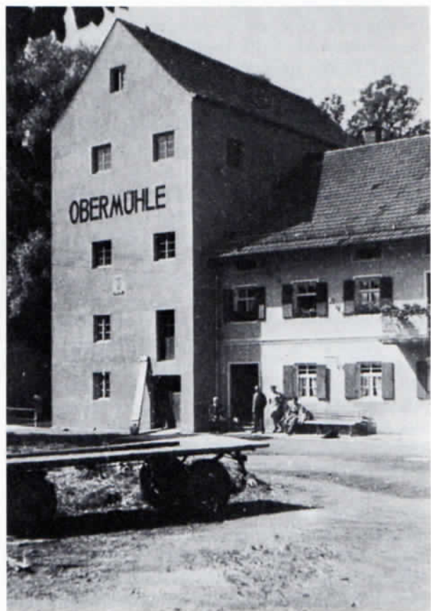
Die heute nicht mehr arbeitende Obermühle in Alling.