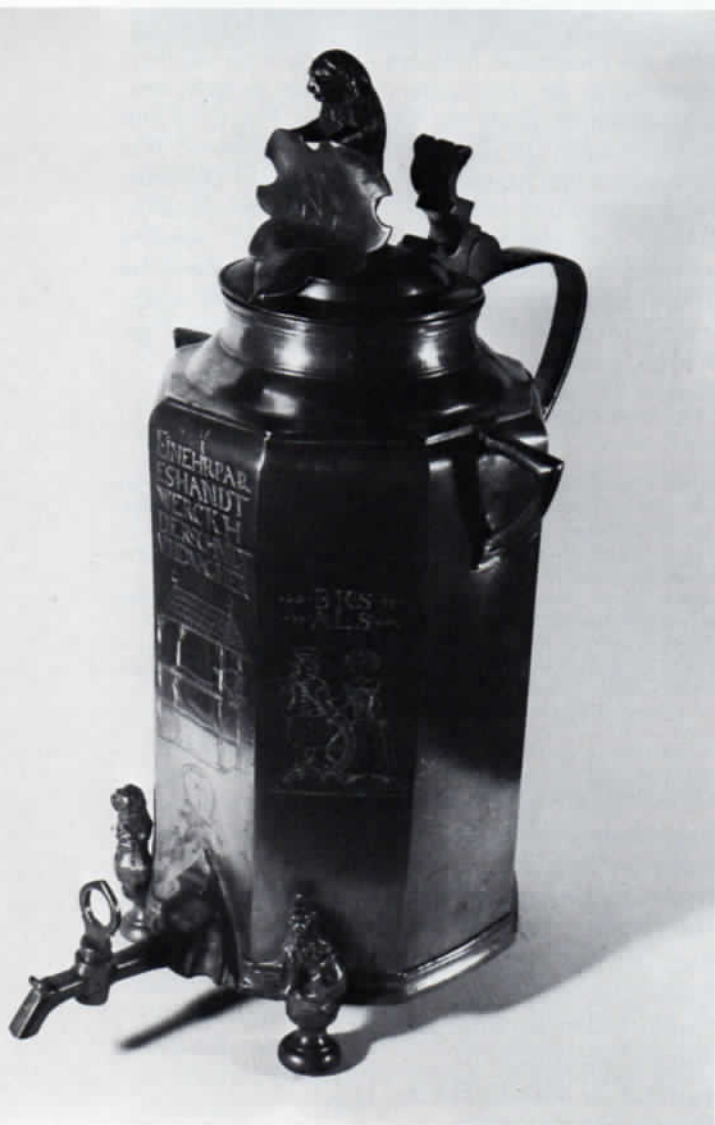
Zimmerne Zunftkanne des Dachauer Schmiede- und Wagnerhandwerks aus dem Jahre 1662, im Besitz des Museumsvereins Dachau.

Die von Montgelas veranlaßte bayerische Gewerbeordnung des Jahres 1804 lockerte das Zunftwesen auf.