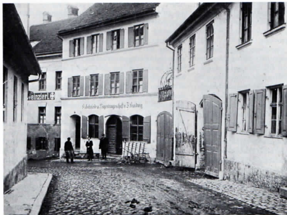
Die Hardwig'sche Schmiede in der Klosterstraße in Dachau vor dem Ersten Weltkrieg.