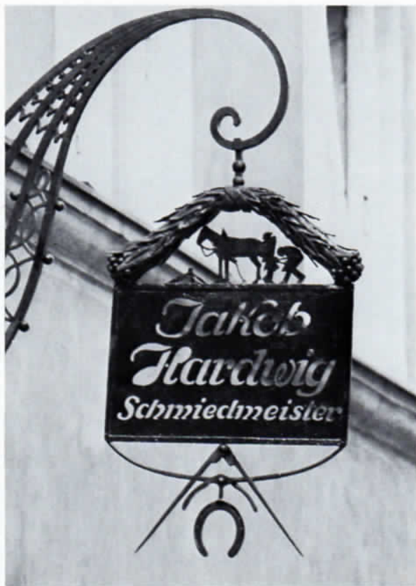
Schmiedeeisernes Firmenzeichen der Hardwig'schen Schmiede in Dachau.