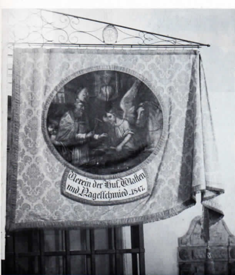
Prozessionsfahne des Gewerbevereins der Dachauer Huf-, Waffen- und Nagelschmied von 1847, im Besitz der Pfarrkirchenstiftung St. Jakob in Dachau.