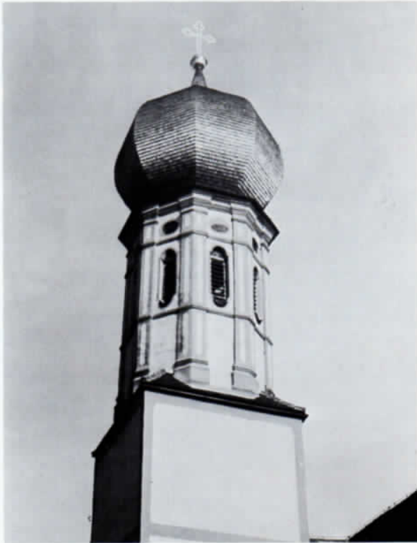
Abb. 1: Turm der ehemaligen Pfarr- und Wallfahrtskirche Obermarchenbach.