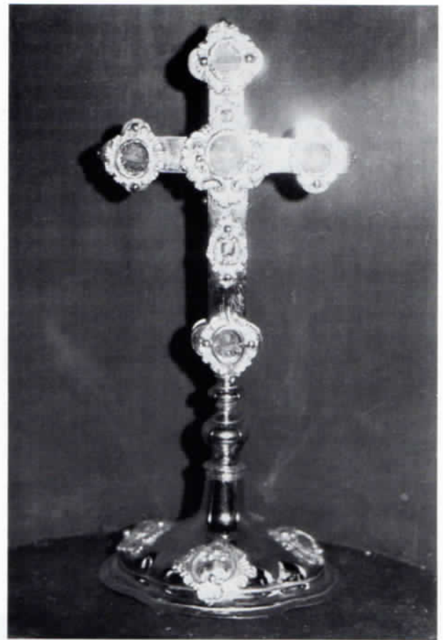
Abb 3: Barockes Standkreuz mit Reliquien und Kreuzpartikel.

In Feuergefahr verlobten sich die Gläubigen nach Obermarchenbach, wie 1687 Guidolbald Albrecht Joseph von und zu Lodron auf Haag: »Anno 1687 den 8. Maij ist zu Haag umb mitternacht ein erschröckliches wetter gewesen, wie auch durch das wilde feur 3 heiser in aschen gelegt und der wind die flamen so wohl schindl als strotächer aufeinander getriben, also daß schon würrklich die ganze hoffmarkh in flamen zu stehen man vermainet habe: Worauf Ihre Hochgfl. gnaden Herr Graff Quilwald albrecht zu dem Hl.