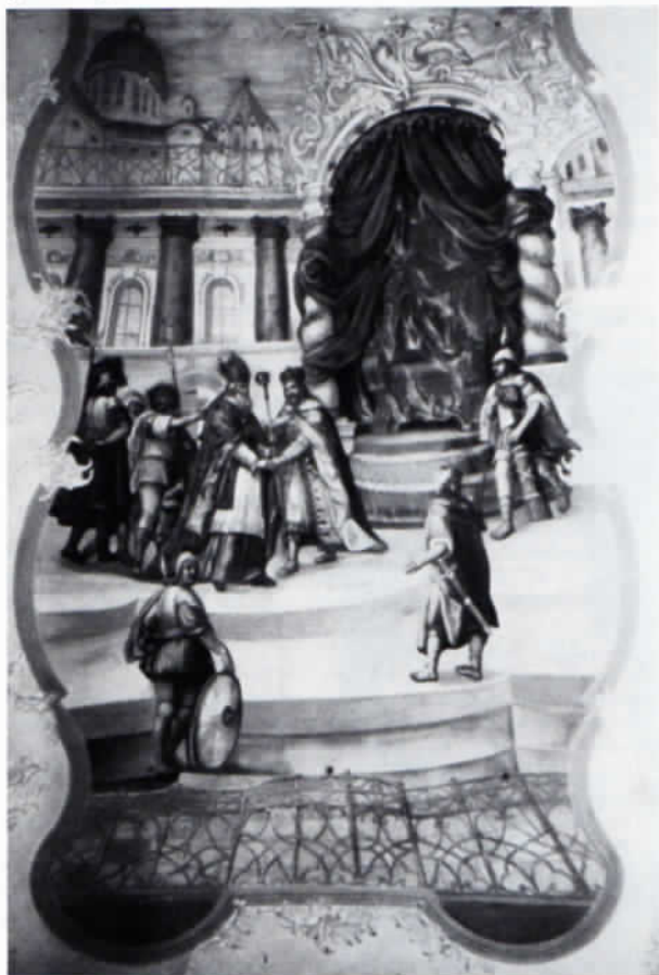
Abb. 3: Unterleutners Deckengemälde im Langhaus der Pfarrkirche Niedering.

Unterleutner hatte in Lengdorf zwei große Deckengemälde im Langhaus geschaffen: die Kreuzigung des hl. Petrus und die Schlüsselübergabe durch Christus an Petrus (Mt 16, 18–19) mit den seitlichen Verweisen auf den Fels (= Kirche), das Schiff, Petrus als Papst (mit den Gesetzestafeln zu Füßen) und die Böcke und Schafe, die dem Angriff des Bösen ausgesetzt sind (Abb. 2).