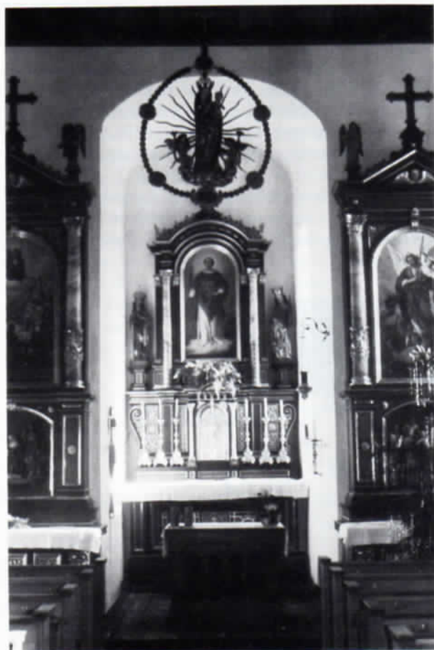
Inneres der Estinger St.-Stephanus-Kirche nach der 1980 abgeschlossenen Renovierung. In den Hauptaltar des späten 19. Jahrhunderts wurden die um 1460/70 entstandenen gotischen Holzfiguren der bl. Katharina und Barbara (rechts und links) aufgenommen. Vor dem Chorbogen eine Rosenkranzmadonna mit zwei Leuchterengeln (um 1490).