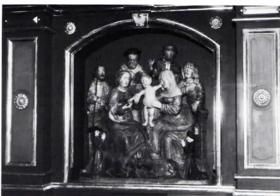
Die heilige Sippe. Holzrelief aus dem 15. Jahrhundert in der St.-Stephanus-Kirche Esting. Das farbig gefaßte Kunstwerk ist heute in einem Seitenaltar des späten 19. Jahrhunderts einbezogen.