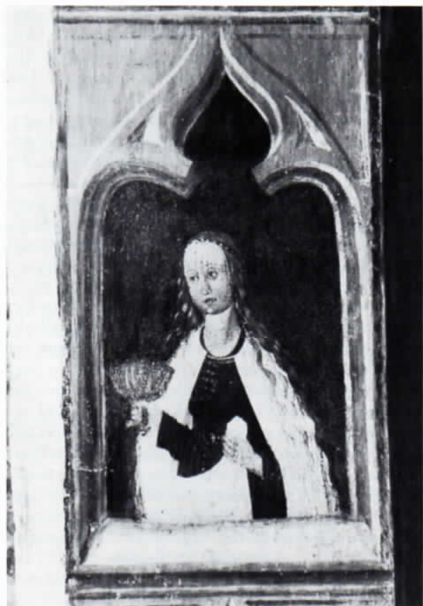
Abb. 5: Kluge Jungfrau. Fresko an der Laibung des Chorbogens in St. Wolfgang von 1479.

Die unumgänglichen Konservierungsmaßnahmen führte die Franz Mayer'sche Hofkunstanstalt (München) aus, deren seit 1848 gewonnene Erfahrung in der Glasgemäldeerhaltung sich dem Projekt als förderlich erwies. Nach Abschluß der Arbeiten wird man feststellen dürfen, daß das Ziel, die Korrosion des Glases und damit den Verfall dieser Glasgemälde wenigstens größtenteils aufzuhalten, erreicht wurde. Im wesentlichen wurden nach dem Ausbau der Glasscheiben in der Werkstätte folgende Arbeitsgänge vorgenommen: Vorsicherung und teilweise Reinigung der Malerei. Sichtbare Ränder wurden nicht stehen gelassen. Die modernen, wohl 1946 eingefügten Gläser wurden wegen ihrer Grelle entfernt und durch älteres Glas ersetzt oder durch Duplierung abgedämpft. Vorsichtige Aufhellung war an den vom Wetterstein besonders stark befallenen Stellen nötig. Zur weiteren Bestandssicherung wurden alle sechs Glasmalereifelder mit Messing-U-Rahmen eingefast und mit entsprechenden Messing-Verstärkungsprofilen befestigt. Bei der Montage