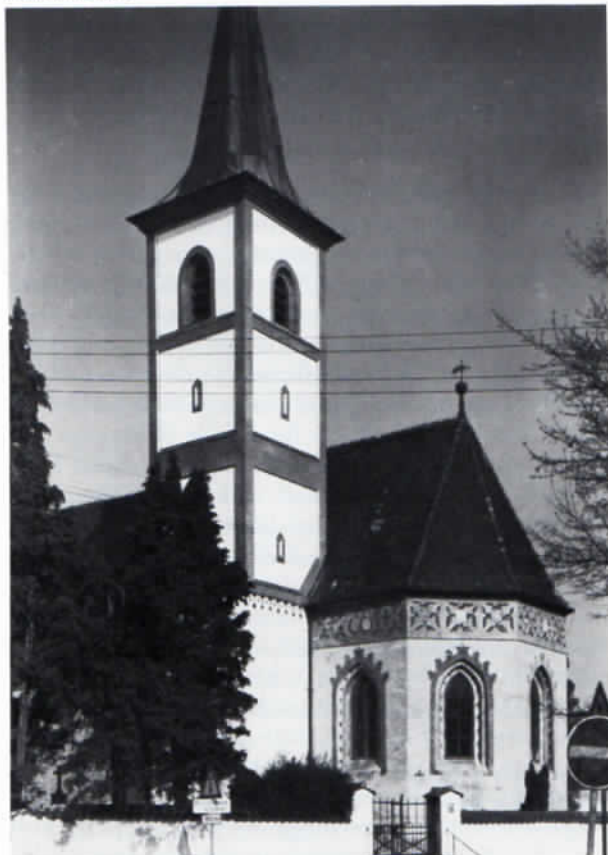
Abb. 3: Der Turm von St. Wolfgang, der seit der Renovierung 1979 wieder in der Fassung des frühen 16. Jahrhunderts erstrahlt.