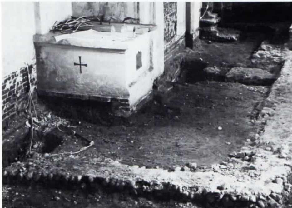
Abb. 2: Die im August 1977 freigelegten Fundamente des Vorgängerbaus der jetzigen Wolfgangskirche.

Konradinischen Matrikel noch nicht unter den Filialen der Pfarrei St. Quirin in Aubing aufgeführt ist und auch Pipping selbst in den bisher erschlossenen Urkunden erst 1352 zum ersten Mal genannt wird. Auch