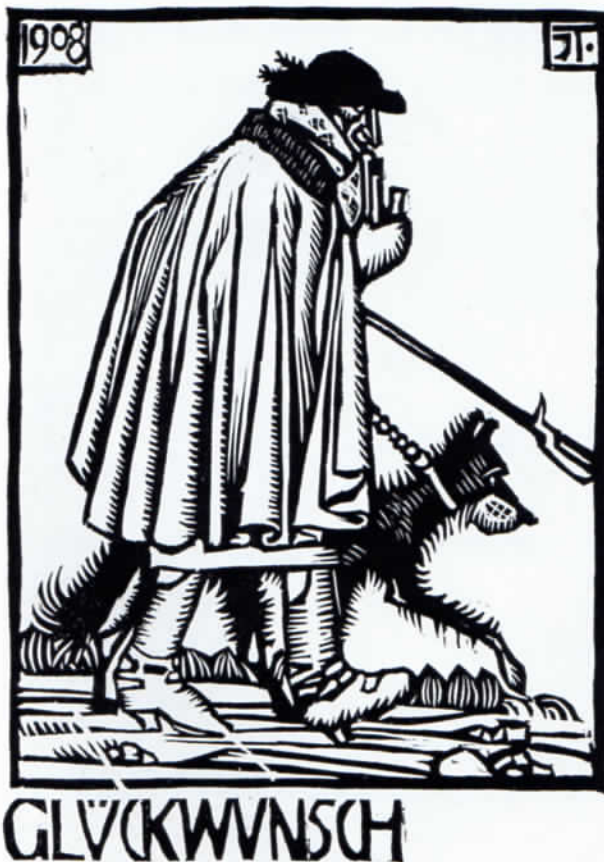
Abb. 1: Ignatius Taschner: Neujahrskarte 1908. Druck 12,5 x 8,5 cm.

Für das ländliche Motiv findet sich alsbald eine gute Erklärung. Taschner hatte viel in Städten gelebt, in Berlin und zuletzt als Kunstprofessor in Breslau. Nun wollte er fortab aufs Land ziehen. 1907 hatte er mit