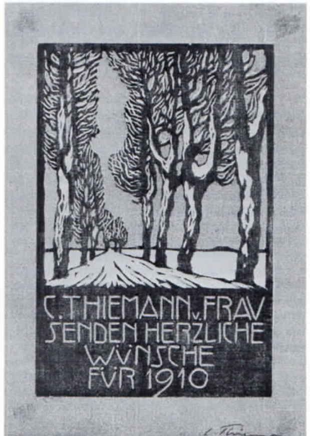
Abb. 2: Carl Thiemann: Neujahrskarte 1910. Farbholzschnitt 12,5 x 8 cm.