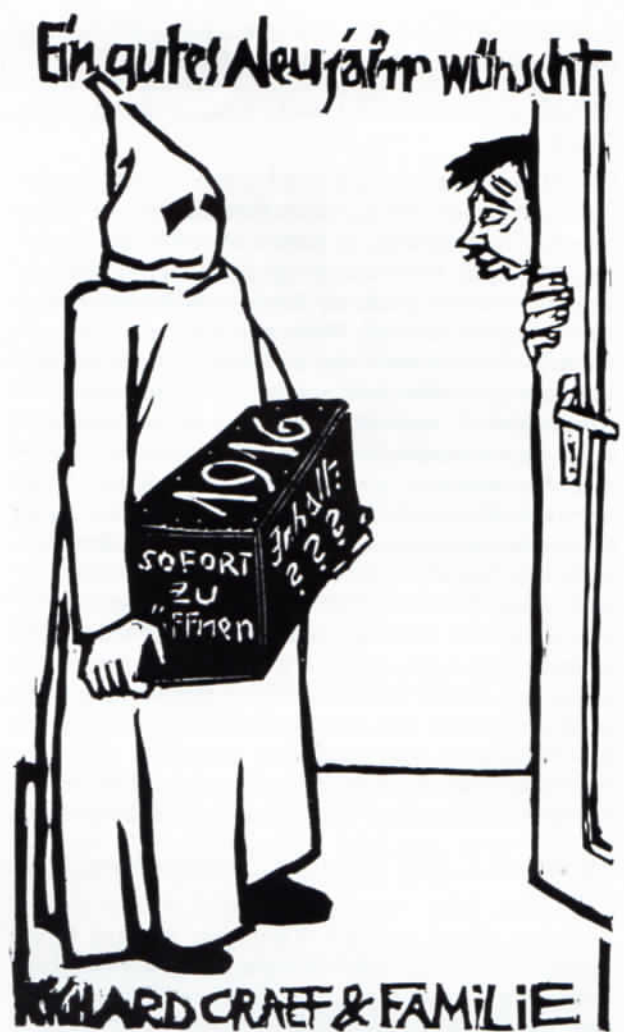
Abb. 6: Richard Graef: Neujahrskarte 1916. Druck 17 x 11 cm.