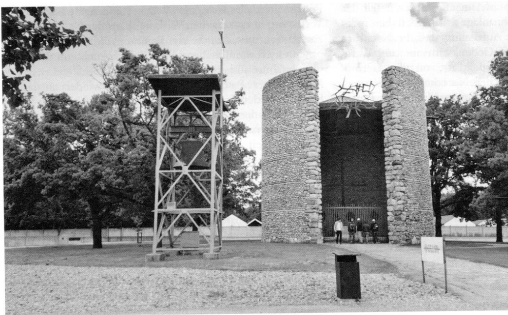
Die Todesangst-Christi-Kapelle, eingeweiht am 5. August 1960