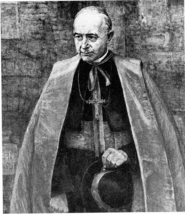
Erzbischof Joseph Kardinal Wendel (1952–1960)