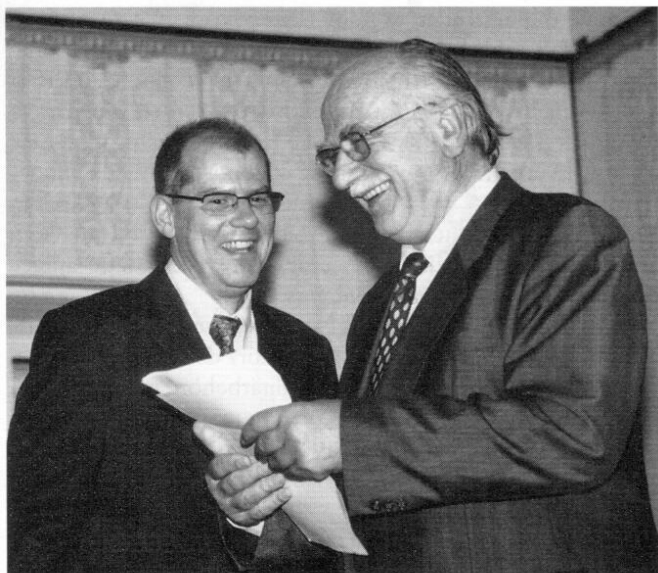
Autor und Jubilar am 26. Oktober 2001