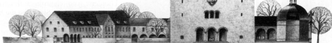
Aufsicht von Westen her

KZ-Gedenkkirche denken mochte; im Gegenteil hat er mich, wenn ich darauf drängte, bei den Behörden lächerlich gemacht mit dem steten Hinweis: Das KZ ist vorbei! darum soll man das Lager vernichten! und es soll keine Gedenkstätte errichtet werden! 12