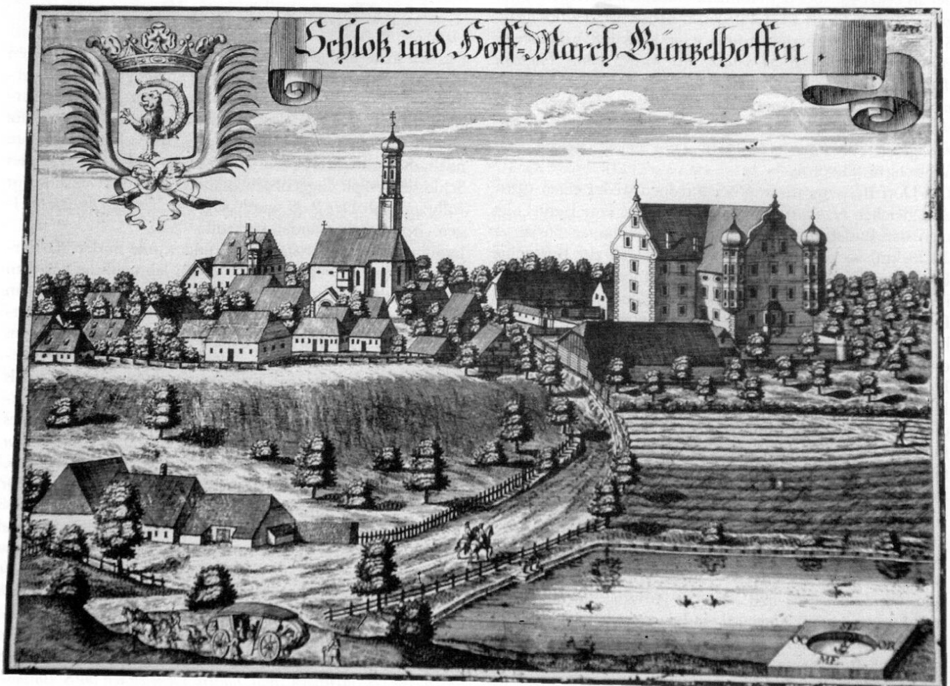
Schloss Günzlhofen, Kupferstich von Michael Wening, um 1701