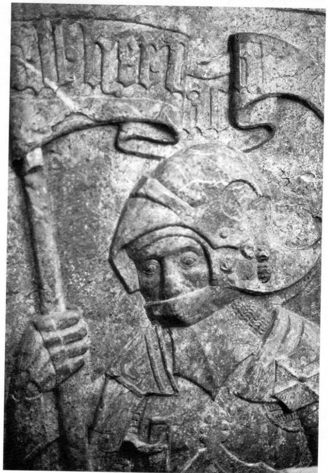
Ausschnitt aus dem Epitaph für Jeronimus Perwanger, 1507