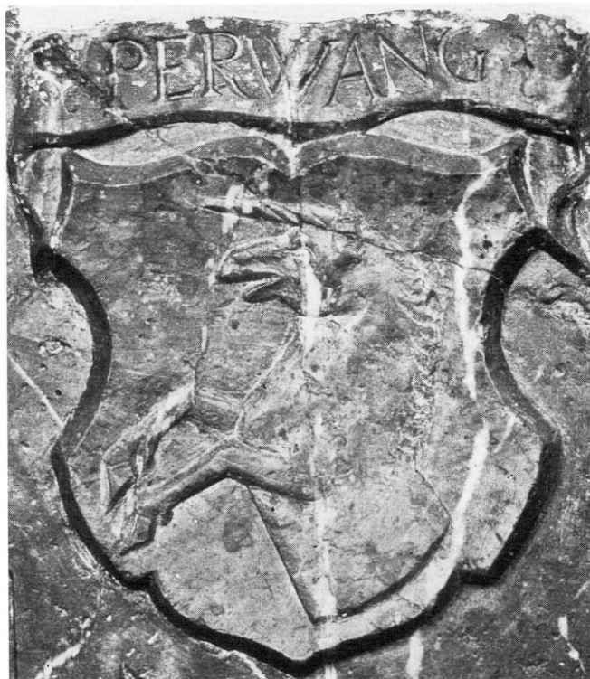
Wappen der Perwanger