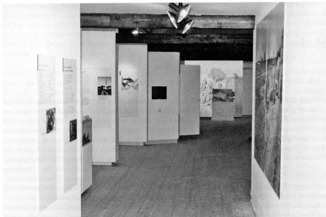
Blick in die neugestaltete Vorgeschichts-Abteilung im Stadtmuseum.

Durch eine reiche Hinterlassenschaft in vielen Orten des Landkreises wissen wir auch über die römische Besiedelung in unserem Landkreis ziemlich gut Bescheid. Waren die Siedlungen der Bajuwaren wieder, wie vor den Römern, auf die Amper ausgerichtet, orientierte man sich nach deren Einmarsch in Rätien ab 15 v. Chr. bis zum Ende des Imperiums Mitte des 5. Jahrhunderts n. Chr. am Verlauf der Römerstraße von der Provinzhauptstadt Augusta Vindelicum (Augsburg)