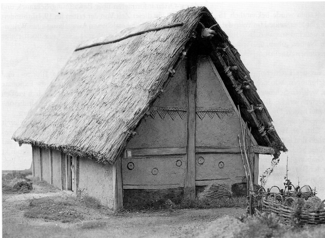
Modell eines Hauses aus der keltischen Hallstattzeit, wie es in Maisach gestanden haben könnte.