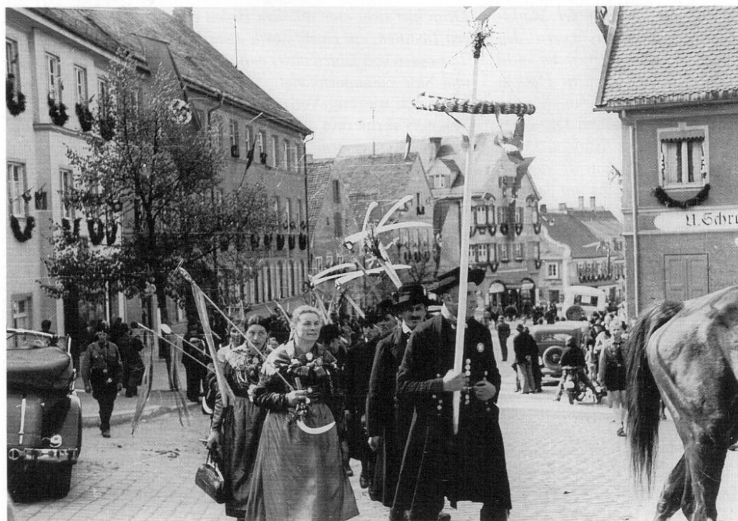
Der große Festzug zur Stadterhebungsfeier am Sonntag, dem 26. August 1934, in Dachau. Die Entwürfe für den Festzug stammten vom Dachauer Maler Hermann Stockmann.