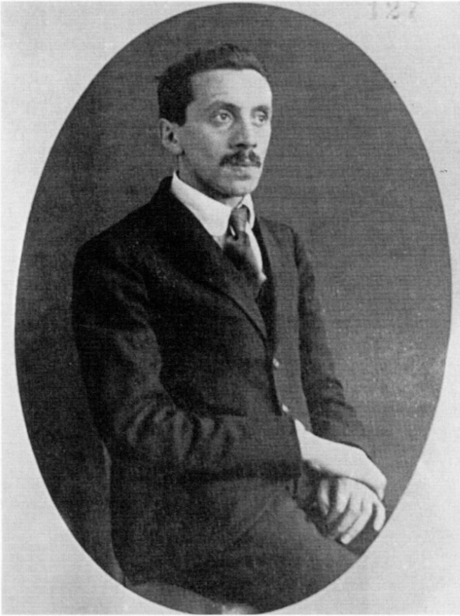
Ernst Toller (1893–1939), Schriftsteller und Kommandant der Roten Armee in Dachau Foto: BayHStA

Im Laufe des Vormittags war auf Seiten der roten Truppen auch schon Artillerie im Spiel gewesen. Zwei Batterien mit sechs Geschützen waren nach Karlsfeld transportiert worden. 153 Die Artillerie hatte einige Male ohne Wirkung auf das Gelände südlich des Bahnhofs geschossen. 154 Die Batterie Zenetti konnte das Feuer nicht erwidern. Sie sah keine lohnenden Ziele. Außerdem sollte der Ort entsprechend den Anweisungen aus Bamberg nicht in Gefahr gebracht werden. 155 Angeblich hatten die Arbeiter der Pulver- und Munitionsfabrik für den Fall, dass die Weiße Garde mit Kanonen schießen sollte, erneut gedroht, die gesamten Pulvervorräte Dachaus in die Luft fliegen zu lassen. 156