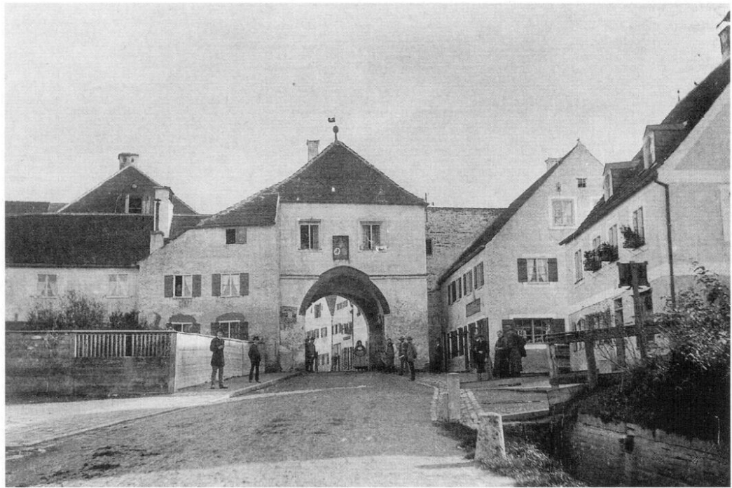
Augsburger Straße mit Augsburger Tor von Norden um 1880