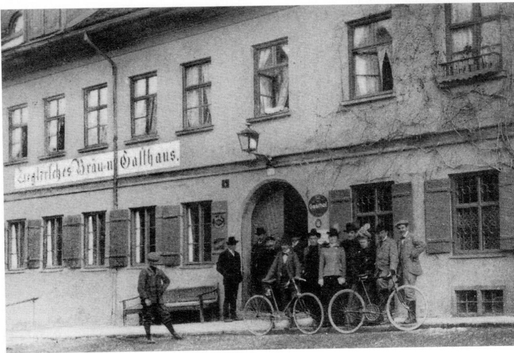
Die Mitglieder des »Fahrradclubs« vor dem Vereinslokal »Zieglerbräu«, 1900

wurde der Markt wieder eine so genannte Munizipalgemeinde und 1818 eine Stadtgemeinde III. Klasse. Damit erhielt die Marktgemeinde zwar Teile ihrer Selbstverwaltung zurück. Unter der Kuratel des Landrichters stehend, musste man nun jedoch stets dessen Zustimmung einholen.