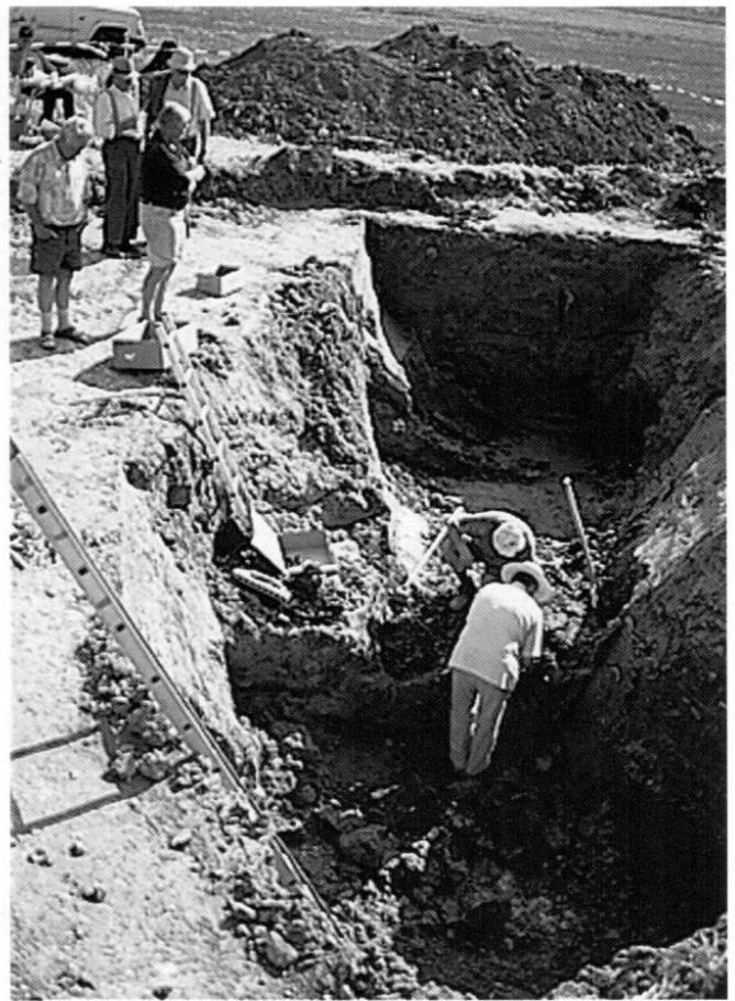
Grabungsfläche, von S nach N, in der Mitte Cockpitbereich