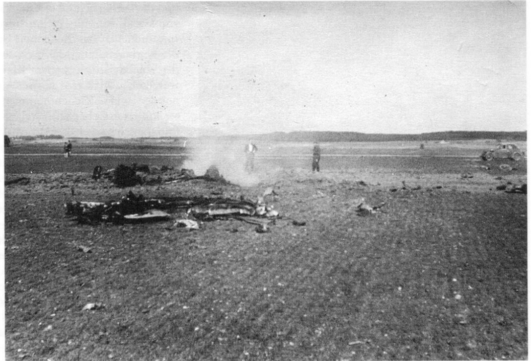
Abgestürzte Lightning, 12. 4. 1944