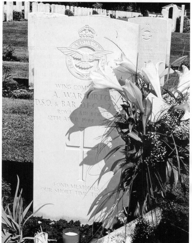
Grabstein in Dürenbach bei Gmund am Tegernsee

Am zweiten Grabungstag wurde ein zweites Propellerblatt, Teile des Motors und des Laders geborgen. Dies waren Teile des linken Rumpfes der Lightning P-38 F5B, die ähnlich im nördlichen Teil der Grabungsfläche vorhanden gewesen sein müssen. Im südlichen Drittel stieß man erst in 3,60 Meter auf