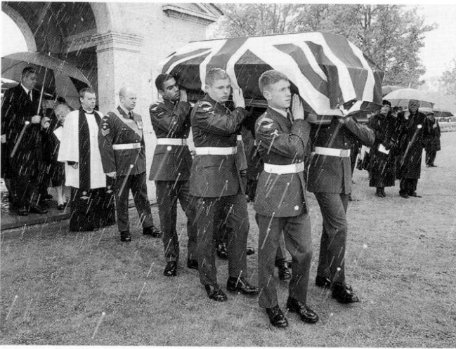
Beerdigung in Dürenbach, 14. 5. 2003