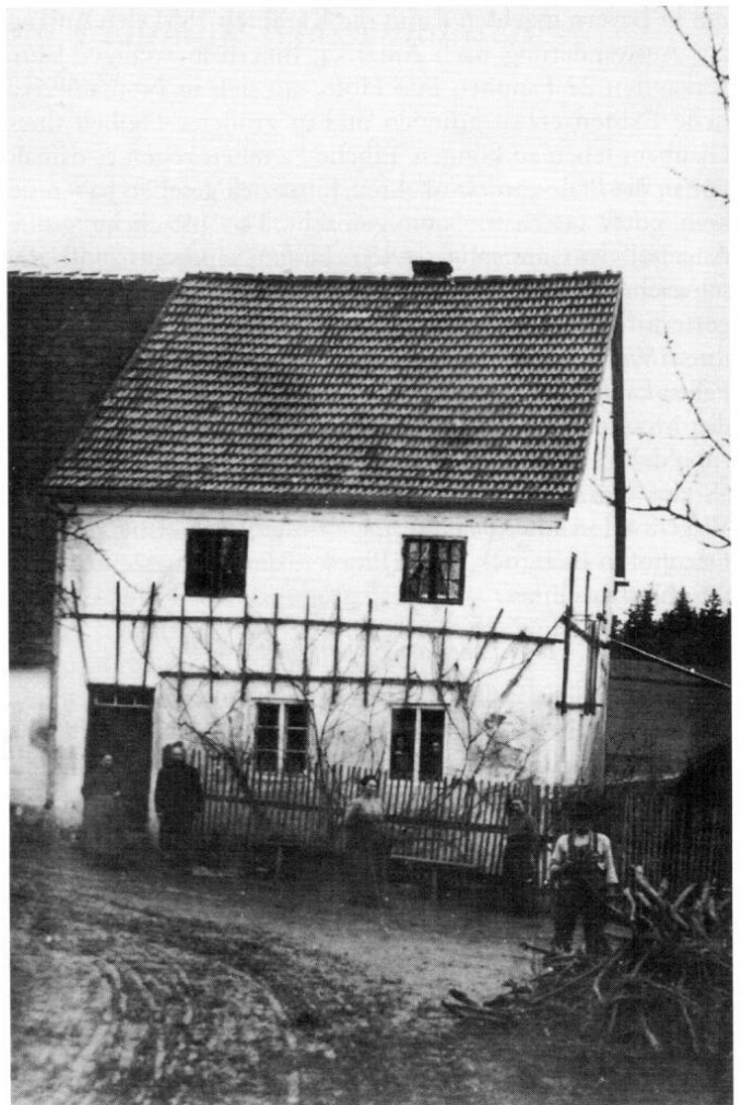
Ursprüngliches Bauernhaus der Familien Dettweiler-Hirschler-Weiß in Stachusried.

Der Gedanke an eine Auswanderung nach Nordamerika fand im Jahre 1848 erhebliche Nahrung. Es war das Jahr der Märzrevolution besonders in den Städten. Am 2. März ging es in