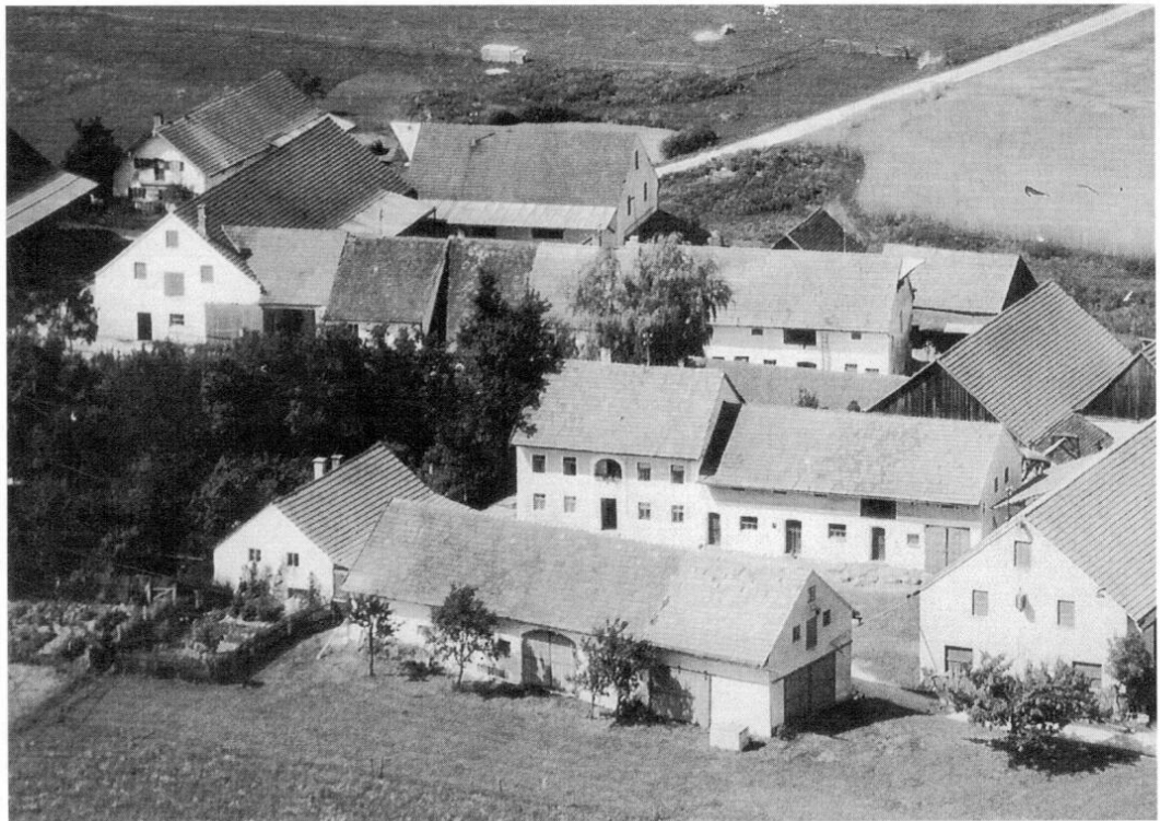
Luftbild von Stachusried, um 1960.