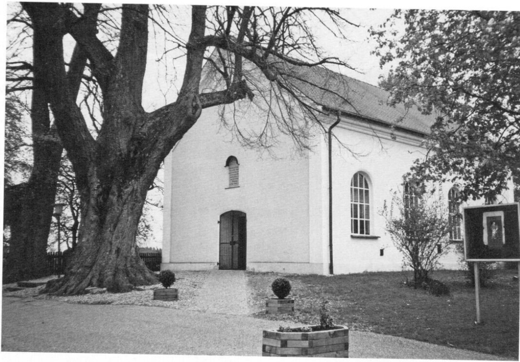
Bethaus der Mennonitengemeinde in Eichstock heute.