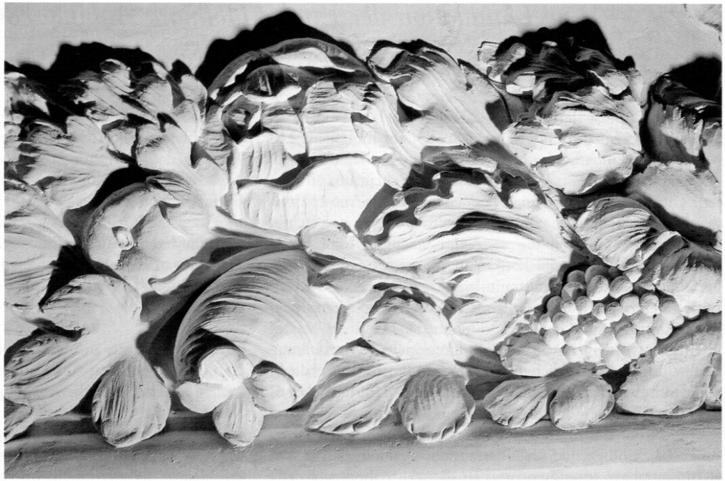
Abb. 3 Stuckdekoration im ehemaligen Kurfürstensaal, Kloster Fürstenfeld vermutlich von Giovanni Nicolo Pertti.