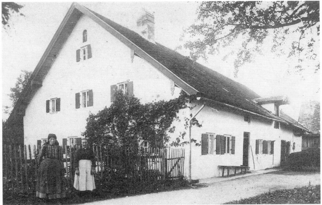
Anwesen Nr. 7 »Zum Zweibrück« um 1930. Seit 2003 ist darin das Heimatmuseum Karlsfeld unterge- bracht.