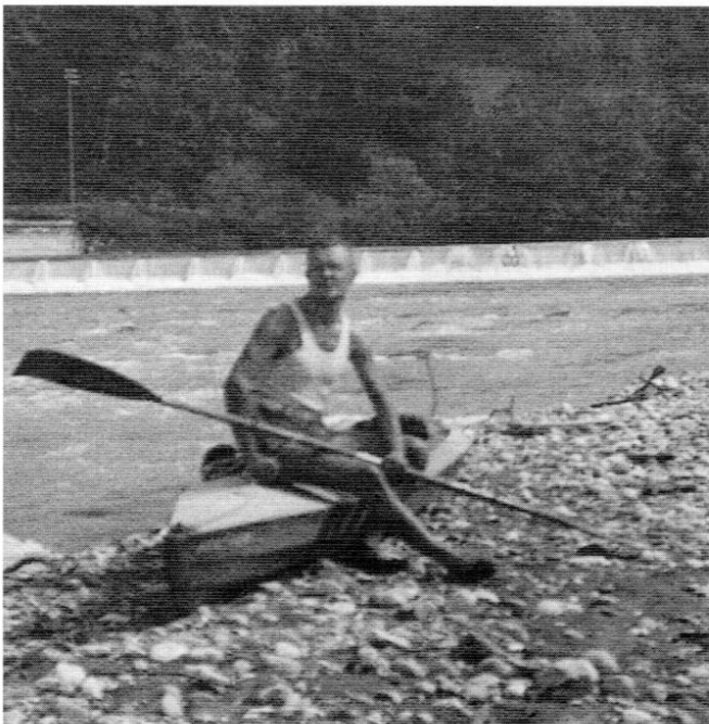
Josef Roth in Rattenberg/Tirol kurz vor seinem Tod am 5. Juli 1941.