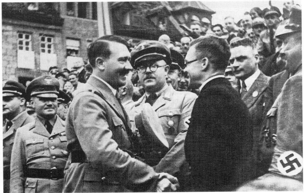
Deutscher Tag der NSDAP in Nürnberg am 2. September 1923.