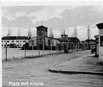
Platz mit Kirche