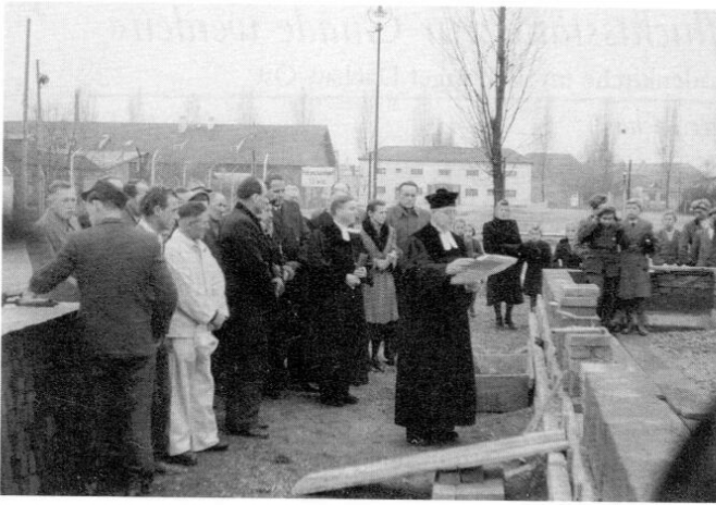
Die Grundsteinlegung zur ersten Gnadenkirche im Wohnlager Dachau-Ost am 1. Advent 1951. An diesem Tag erhielt das Gotteshaus auch seinen Namen.