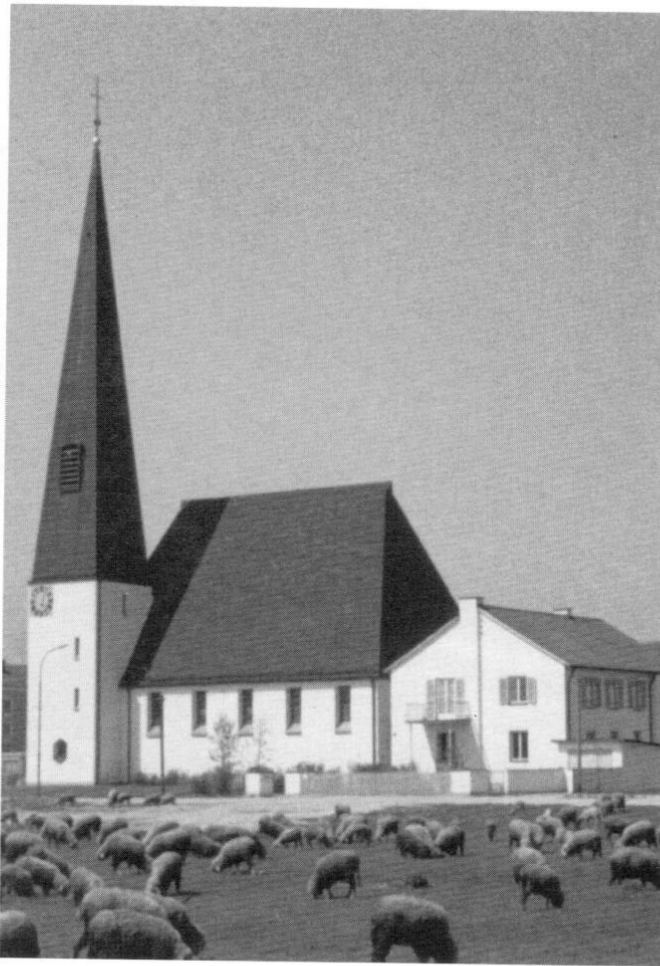
Ein Bau, der ins Auge fällt: Dafür sorgen der 50 Meter hohe Turm und das steile Walmdach der Gnadencirche, das eine Höhe von 26 Metern erreicht.

Etwa in der Mitte des neuen Wohngebiets, das sich zum Stadtteil Dachau-Ost entwickelte, wurde schnellstens ein Bauplatz für ein Pfarrhaus und für eine neue Kirche erworben. Die Einweihung des Pfarrhauses (heute: Gemeindehaus), das in seinem Erdgeschoss einen Betsaal besaß, erfolgte bereits im Jahre 1960.