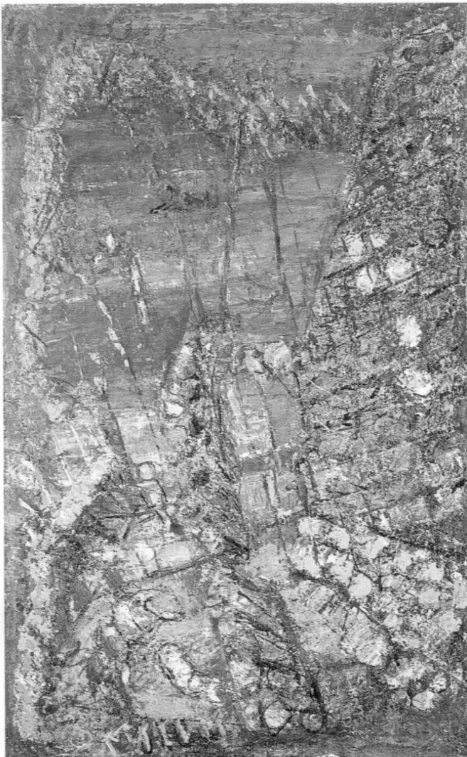
Ohne Titel, Ei-Tempera, 89 x 55 cm, 1988/89.

Für Kunstsammler, Galeristen und Museumsleute ist Tröger schon seit langem ein Geheimtipp. Die Preise für seine Werke beweisen es auf ihre Art. Die erste Ausstellung fand 1977 im damaligen Kunstraum München statt, weitere folgten: 1983 Galerie Tanit, München; 1985 Galerie Fred Jahn, München; 1987 Städtisches Museum Leverkusen, Schloss Morsbroich; 1988 Villa Stuck, München; 1994 Rathaus-Galerie, München;