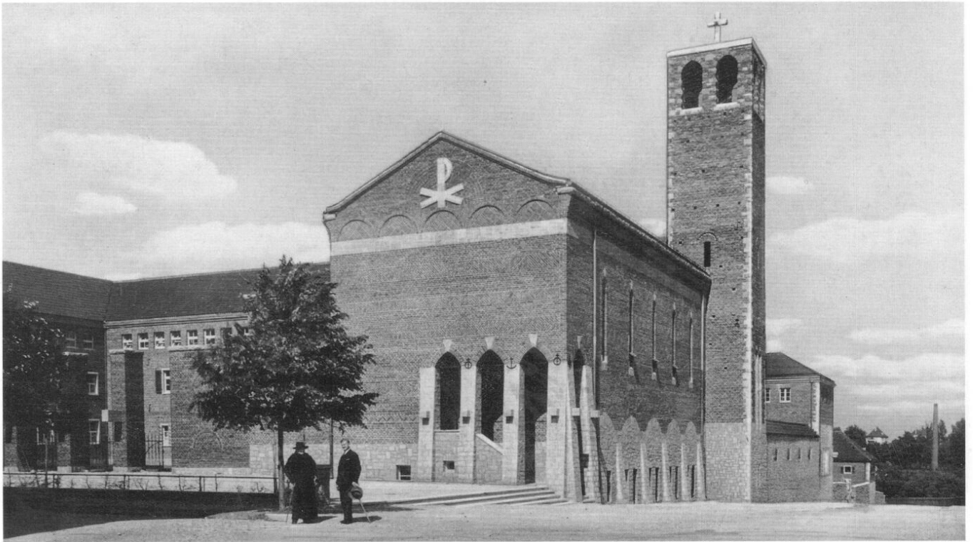
Freising – Missionsseminar der Pallottiner mit Kirche