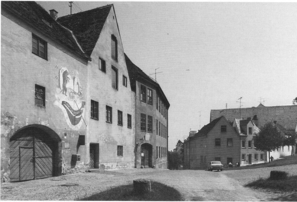
Ehemaliges Altes Hofbräuhaus, zeitweise Niederlassung der Pallottiner

Schüler an der Lunge zu beklagen.« 38 Das »Provisorium«, von dem Kugelmann gesprochen hatte, um keine Ausgaben zu machen, währte bis zum Umzug in das neue Missionsseminar im Herbst 1930, also 11 Jahre, und zeichnete somit mit verantwortlich für die fahrlässige Gesundheitsgefährdung von Schülern, Patres und Brüdern der Gemeinschaft.