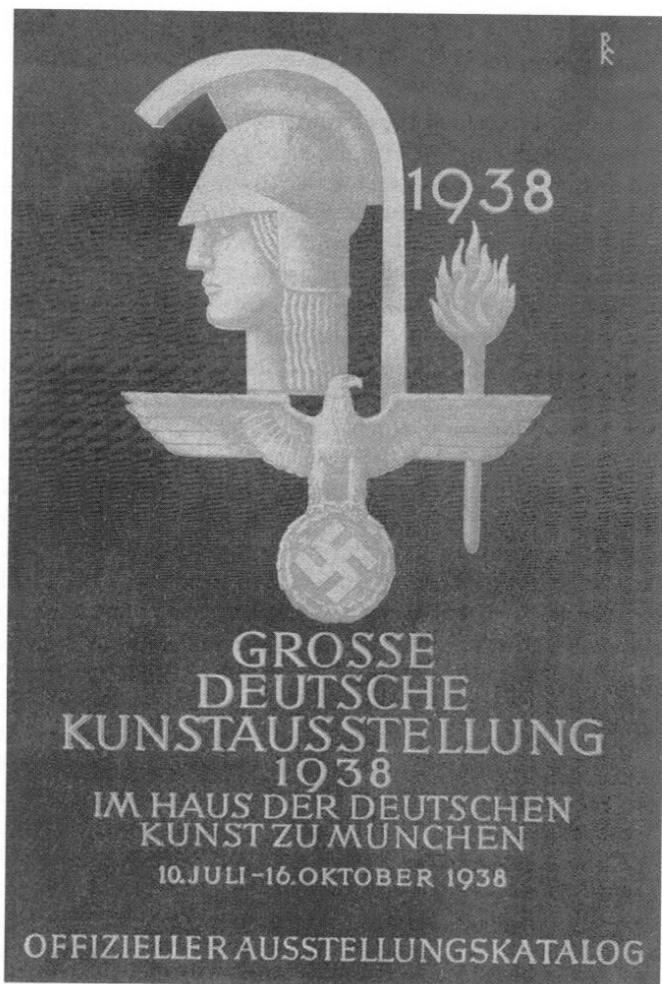
Titelblatt des Katalogs zur Großen Deutschen Kunstausstellung in München 1938.