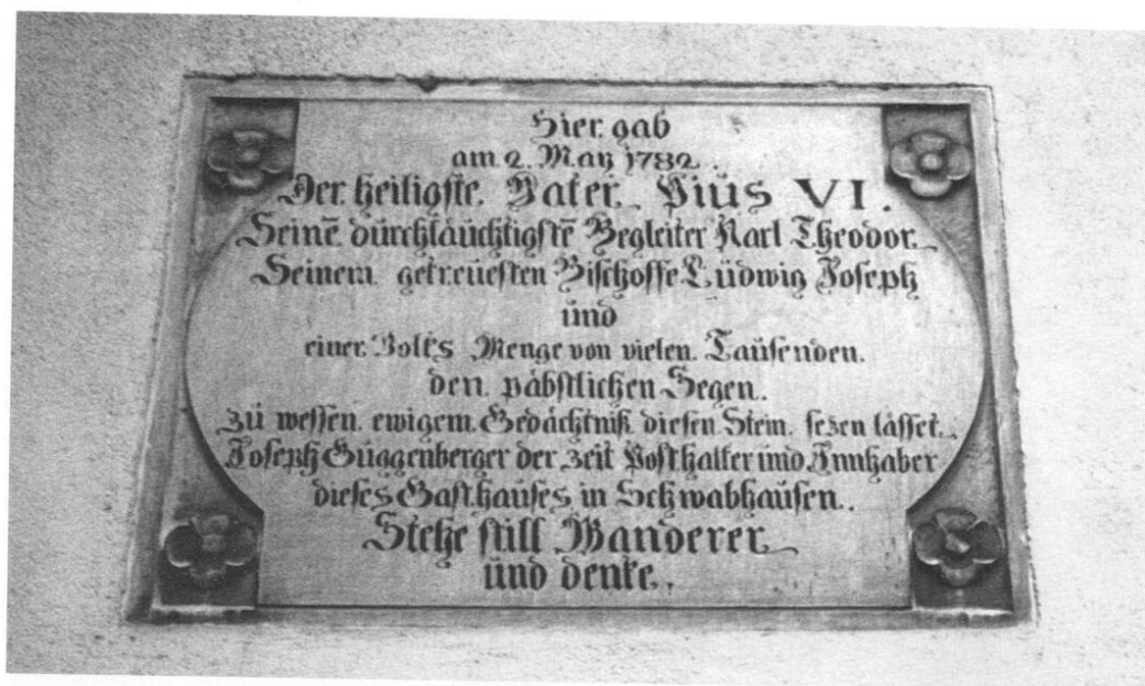
Am 2. Mai 1782 erteilte Papst Pius VI. vor dem Gasthaus zur Post in Schwabhausen einer großen Volksmenge seinen Segen, wie es diese von Posthalter Wirt Guggenberger angebrachte Gedenktafel bezeugt.