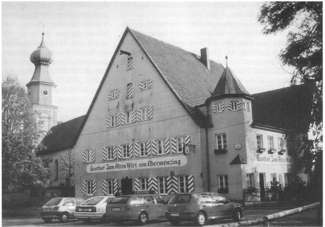
Der Alte Wirt von Obermenzing.

in einem Lagerbuch von beträchtlichen Besitzungen die Rede: ein ziegelgedecktes Hauptgebäude, eine Bretterscheune mit Stockwerk, ein Schindeldach mit anstoßender Stube, ein Wiesengarten gegen die Würm, eine lange Stallung mit aufgebautem Tanzboden, ein einstöckiger Stadel mit Ross-/Viehställen, dazu 1 Tagwerk Ackerland mit Garten beim Wirtshaus, ein zweiter Garten (1 Tagwerk) gegen das Mesnerhaus, insgesamt 46 Äcker mit 31 Joch Land auf Dorfgebiet und dazu noch über 17 Tagwerk außerhalb der Gemeindegrenzen. Kurz nach dieser Bestandsaufnahme erstellte Architekt Rasso Graf 1589 bis 1590 im Auftrag des Herzogs das heutige Gasthaus, einen Repräsentativbau zum stolzen Preis von 1084 Gulden.