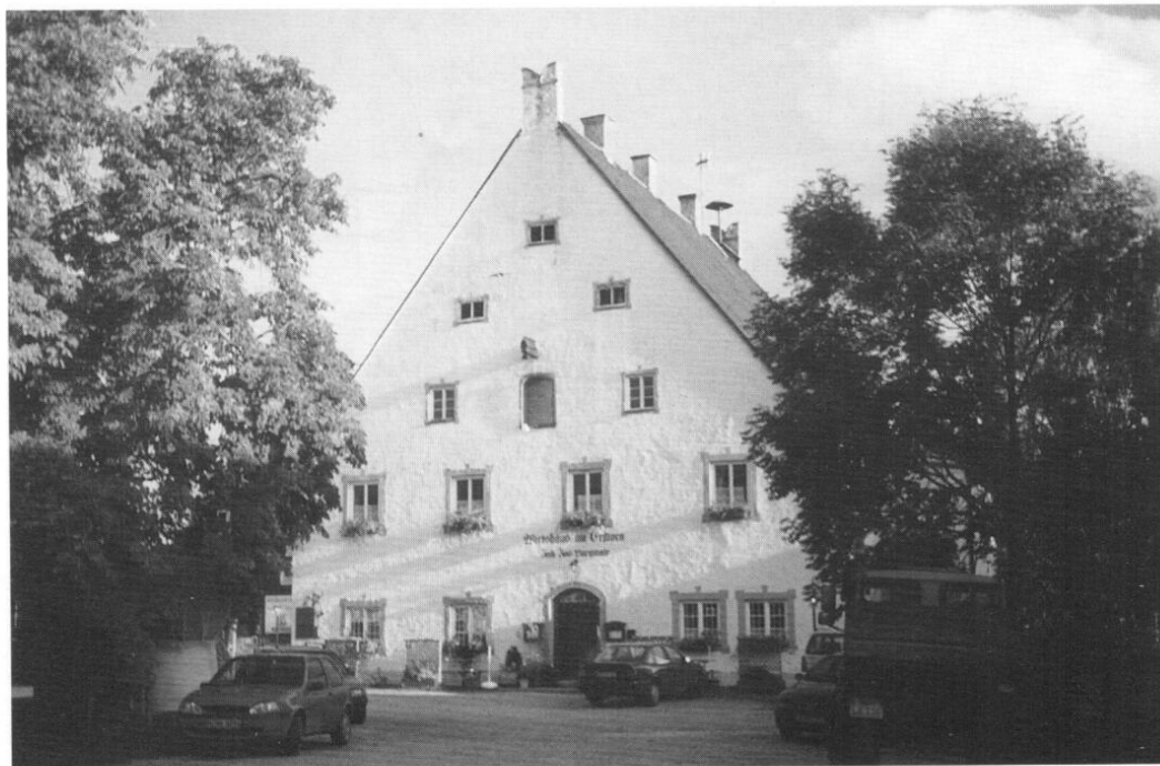
Das mittelalterliche Wirtshaus am Erdweg.

lenbasis ist ebenso günstig. Zwar sind – wie fast überall – direkte Zeugnisse aus Wirtehand bzw. dem Wirtshausalltag äußerst rar, doch finden sich umfangreiche Informationen in einem breiten Spektrum verschiedenster Dokumente. Verwendung finden im Folgenden obrigkeitliche Mandate, Steuerakten und Wirtshausverzeichnisse; Reiseberichte, Bilder und materielle Überreste; Herrschaftsarchive, Gerichtsrollen und Ratsprotokolle, um nur die wichtigsten zu nennen. Angestrebt wird nicht eine detaillierte Untersuchung aller dokumentierten Gaststätten, sondern ein erster Überblick über zahlenmäßige, soziale und kulturelle Aspekte des Gastgewerbes in der »guten alten Zeit«.