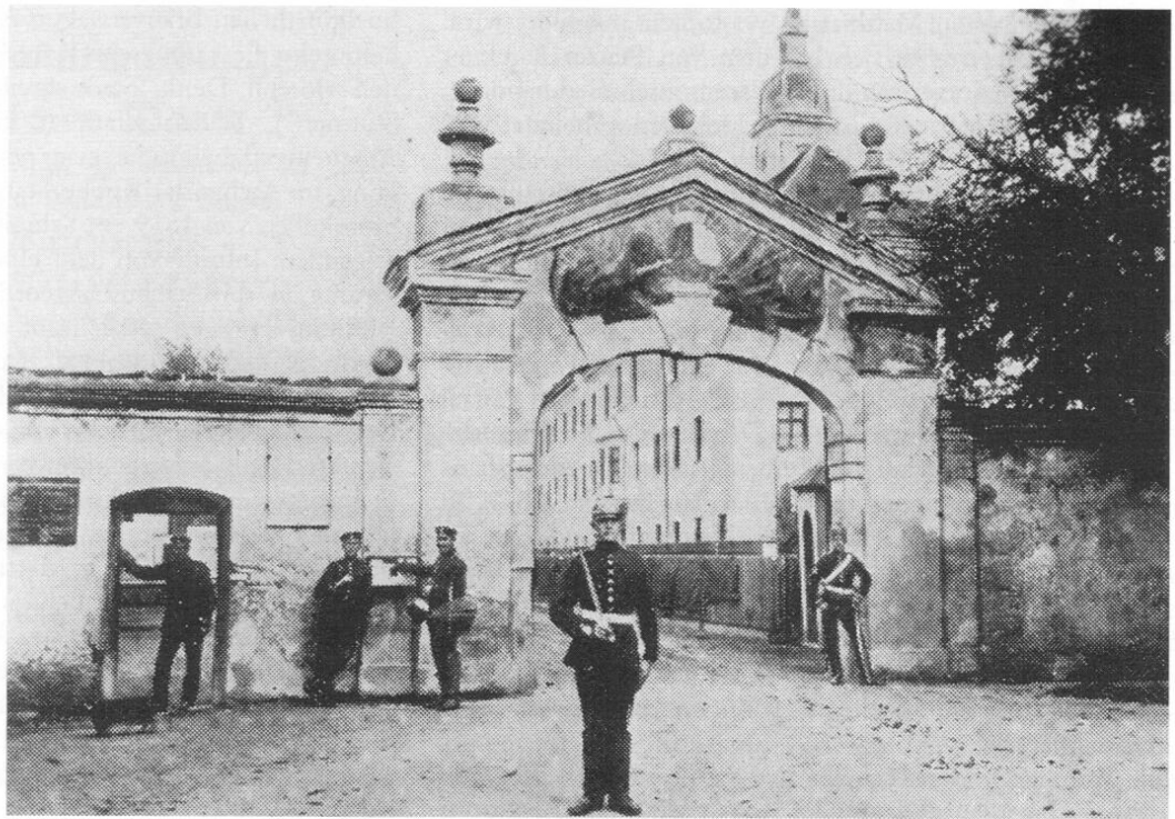
Eingangstor der Kaserne Neustift.