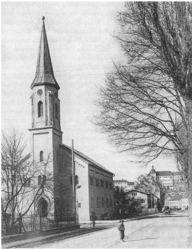
Die erste evangelische Kirche von Freising, erbaut 1862/64.