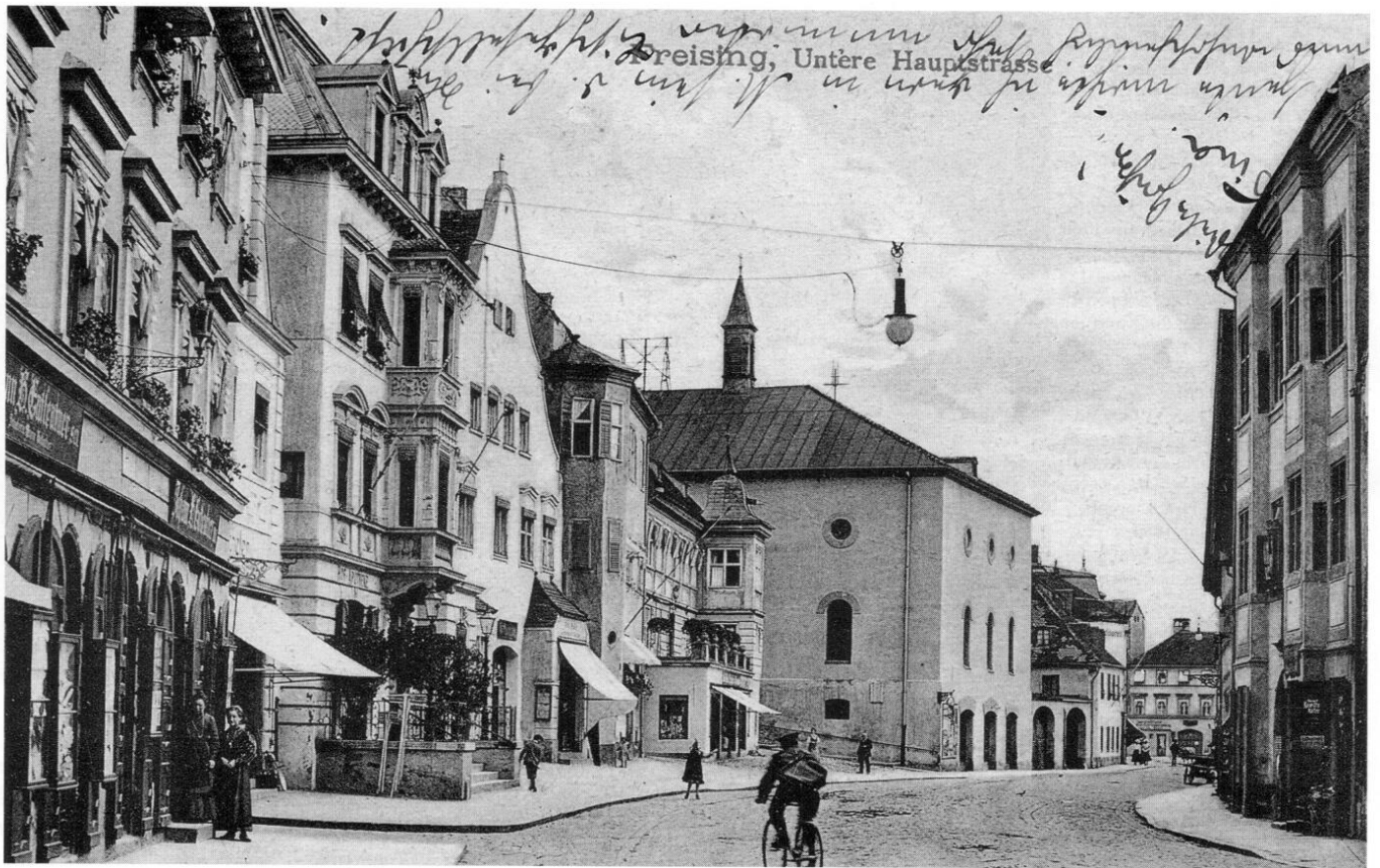
Bei dieser Ansicht der Unteren Hauptstraße ist zwischen dem ehemaligen Hofkanzlerhaus (vorne) und dem Elefantenwirt (dahinter mit Doppeltorbogen) die mächtige Fassade der Schulkirche mit der angebauten Mädchenschule, die 1843 anstelle der alten Franziskanerkirche von Johann Bernlöchner erbaut wurde, zu sehen.