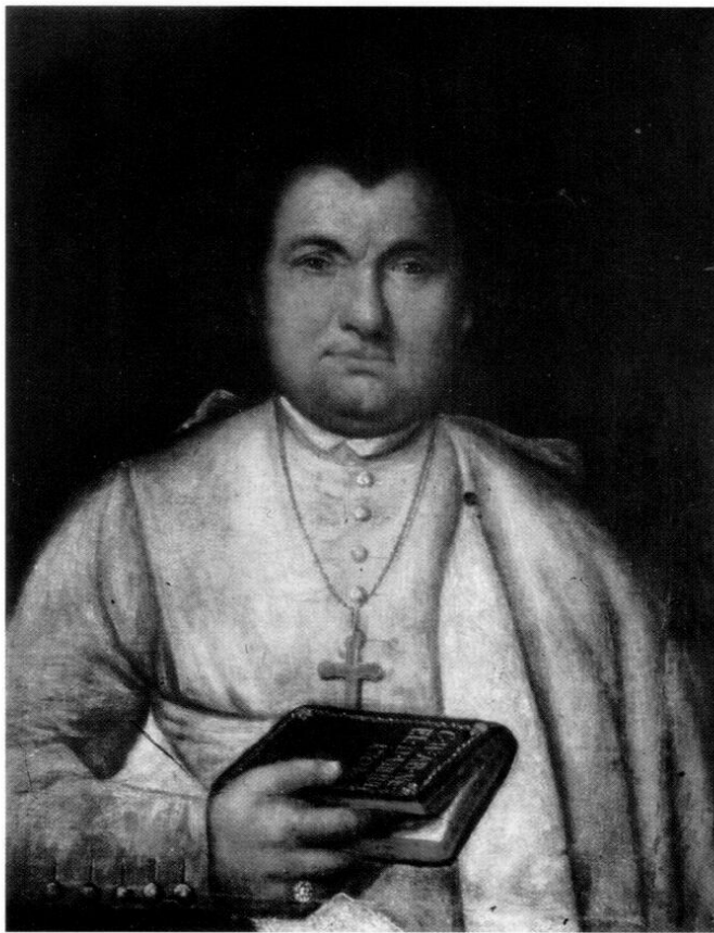
Castalus Wohlmuth, der letzte Abt des Klosters Neustift (1794–1802). Gemälde im Museum des Historischen Vereins Freising.