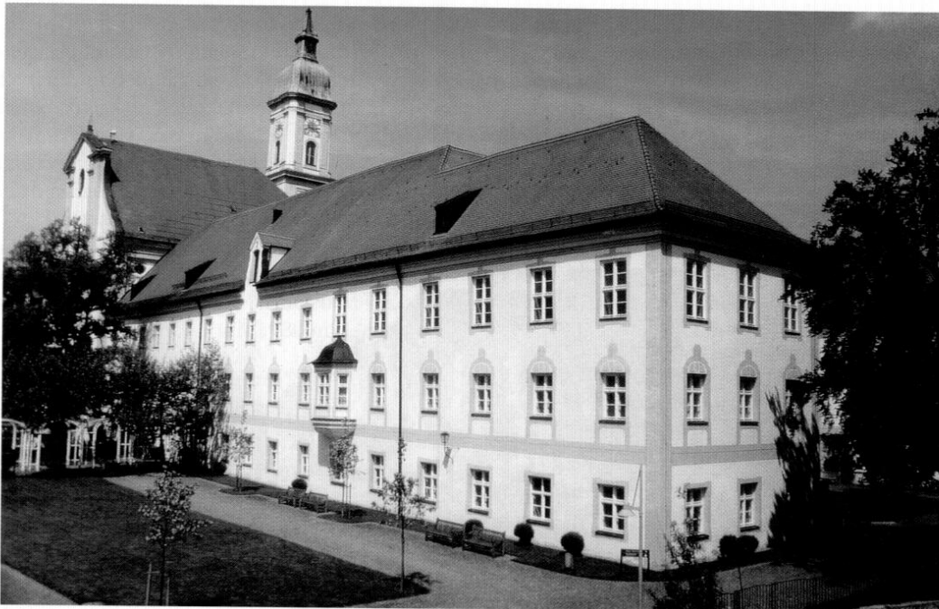
Ansicht des heutigen Landratsamtes Freising von Südwesten mit der ehemaligen Klosterkirche im Hintergrund.

mitbetreut. 1858 wurde Neustift zur Expositur erhoben. 1881 kaufte die Gemeinde das Gotteshaus dem königlichen Ärar um tausend Mark ab und renovierte es. Seit 1892 ist St. Peter und Paul eine selbständige Stadtpfarrei. 50